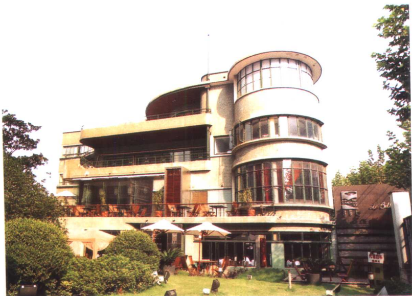
原吴同文宅——现代式建筑