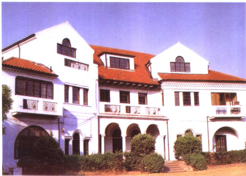
原丁贵堂宅——西班牙建筑风格