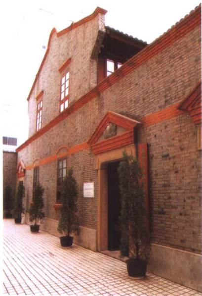
毛泽东旧居——老式里弄建筑