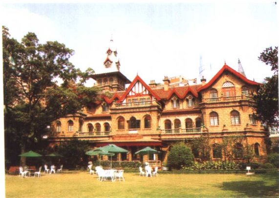
原马勒故居——北欧建筑风格