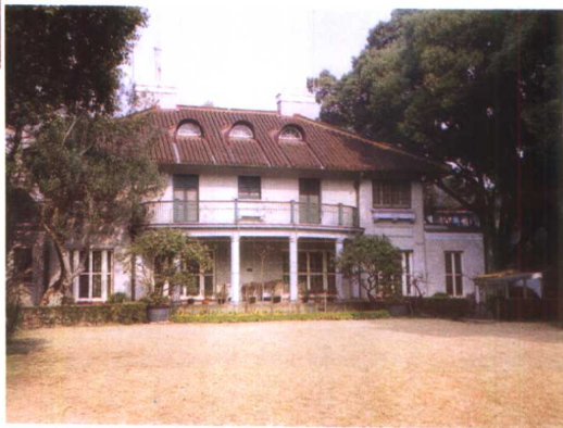
宋庆龄故居——现代形式建筑