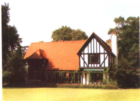
原沙逊别墅——英国乡村建筑风格