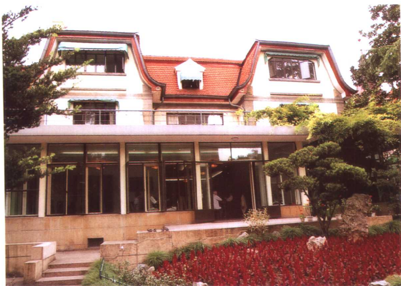
原宋子文宅——法国式建筑