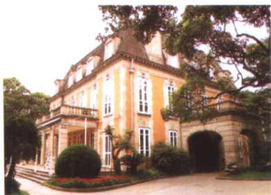
原马歇尔公馆——法国古典主义建筑