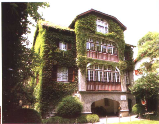
周恩来旧居——仿法国式建筑