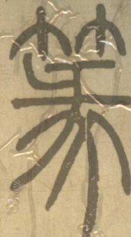
清 鄧瑛 萬綠帖