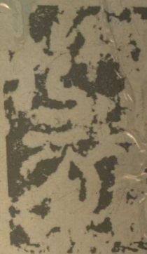
唐 瞿令問 唐廡銘