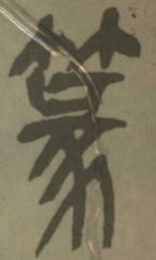
清 吳昌碩 西泠印社記