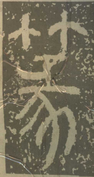
唐 李陽冰 張從申玄靜先生碑額