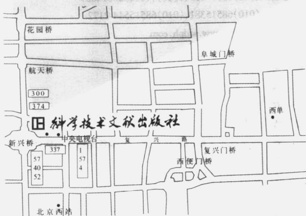
科学技术文献出版社方位示意图