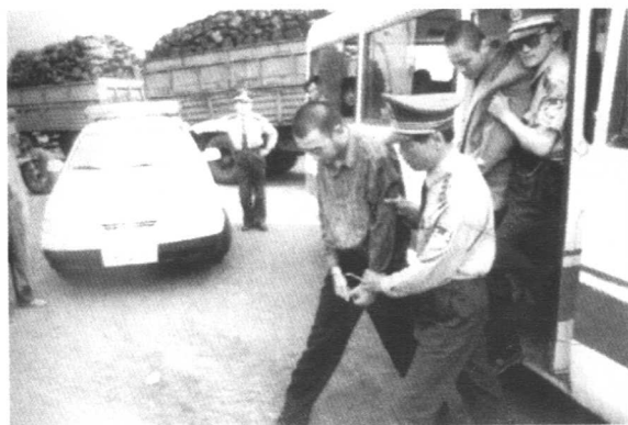
警方押解犯罪嫌疑 人回国