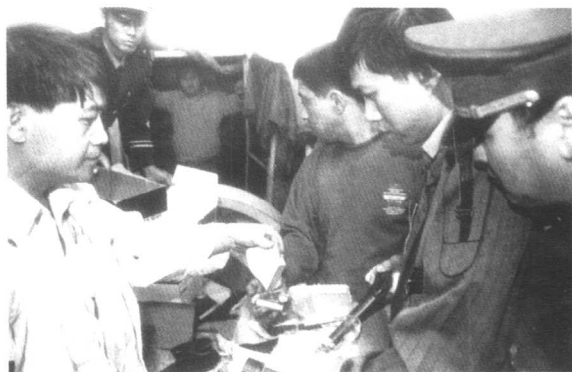
刑警在仔细勘察现场