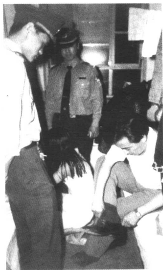
刑警在仔细勘察现场