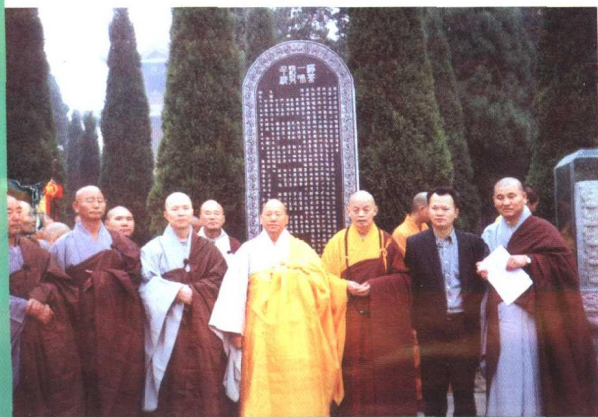
◀ 中国和韩国高僧在“禅茶一味”碑前合影