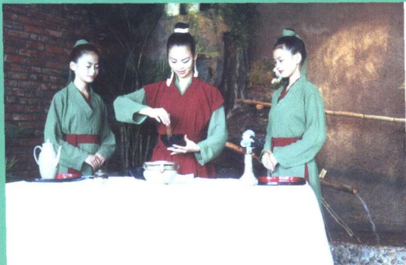
▲ 南昌女子职业学校茶艺队表演“仿宋茶艺”