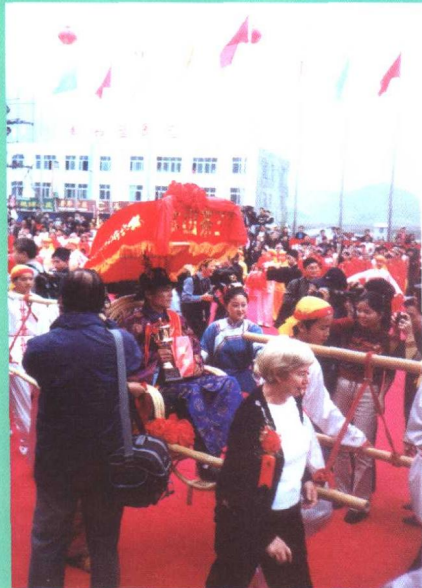
◀ “茶王上轿” 巡游