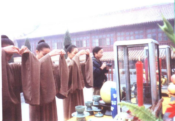
▶ “以茶为祭” 礼仪