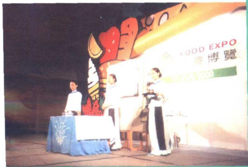
▶ 南昌女子职业学校茶艺队在香港美食博览会表演“文士茶”