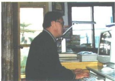
著名茶文化专家余悦教授在书房写作