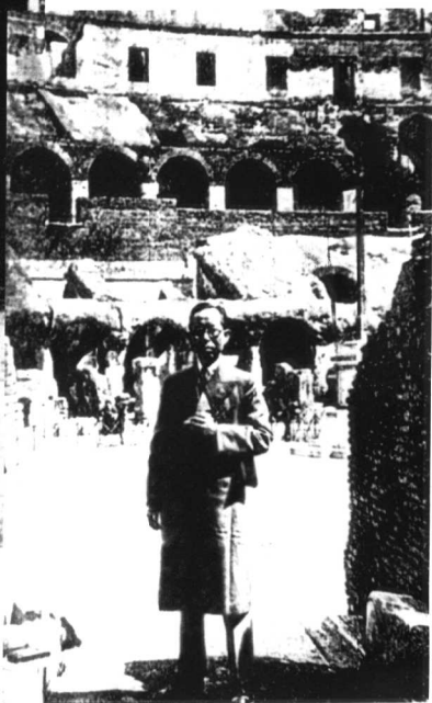
1934年摄于古罗马竞技场门口