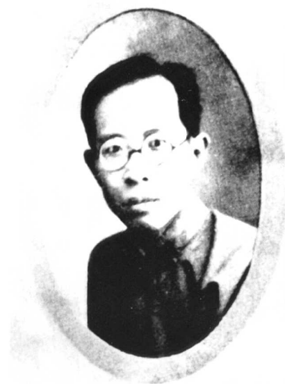
1931年摄于吉林四平东北第一交通中学