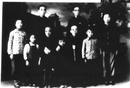
1957年秋摄于济南庆云照相馆 与全家最 后一张合影