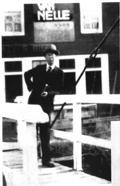
1934年9月末摄于荷兰马尔肯渔村岛上