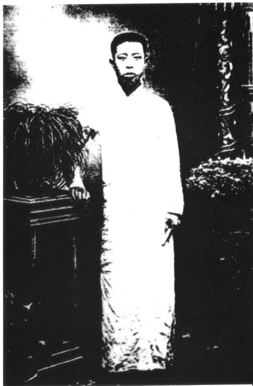
中学时代摄于济南