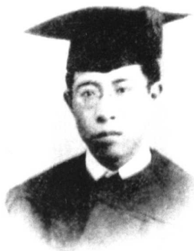
1922年中国大学毕业时 在北京