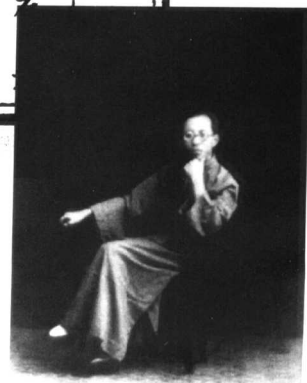
《劍嘯廬詩草》自序手迹