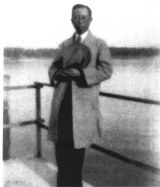
1934年4月28日摄于日内瓦丽芒湖桥上