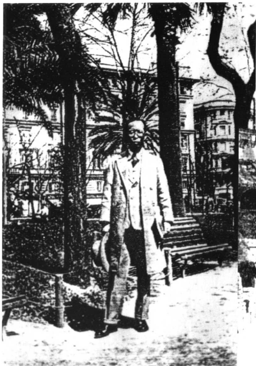
1934年赴欧途中 摄于棕榈岛