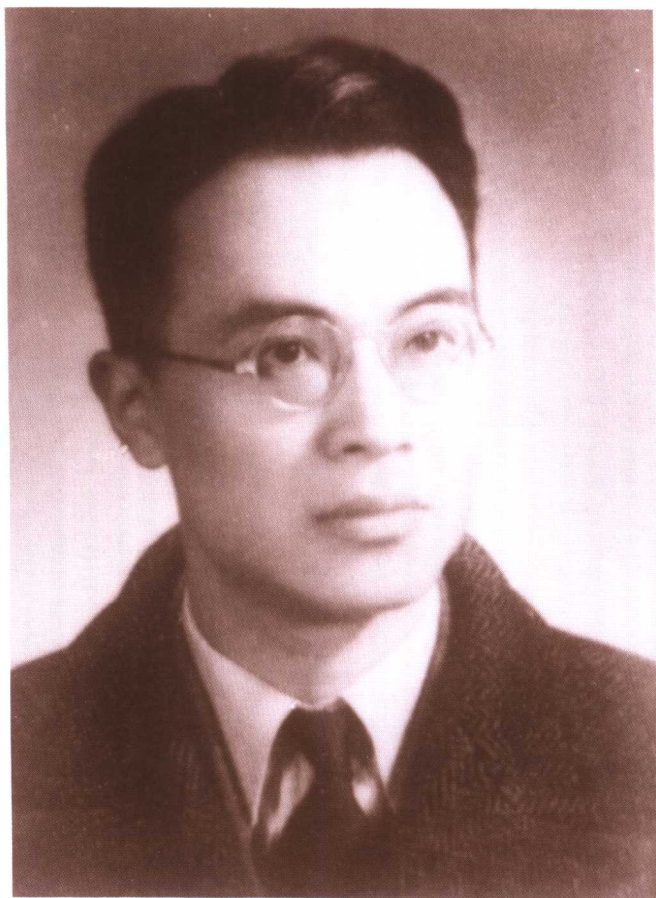
● 四十年代初写《围城》的钱鍾书