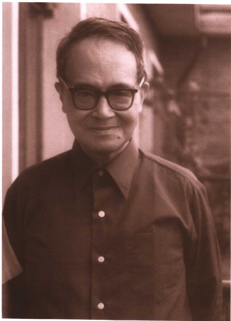
● 八十年代钱鍾书在南沙沟家中