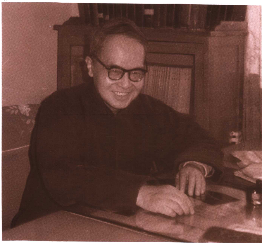
八十年代钱鍾书在南沙沟家中