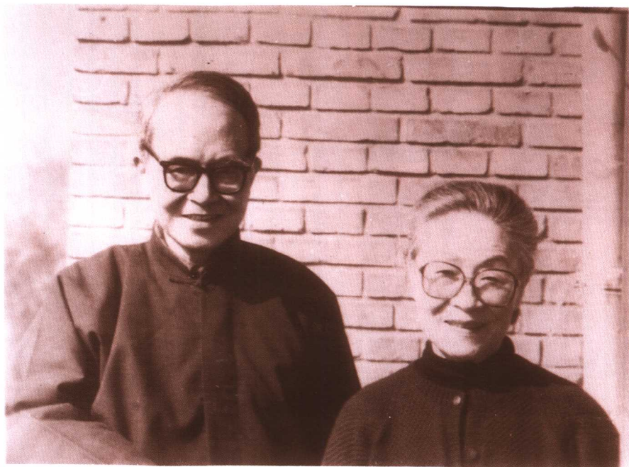
●八十年代钱鍾书和杨绛在南沙沟阳台