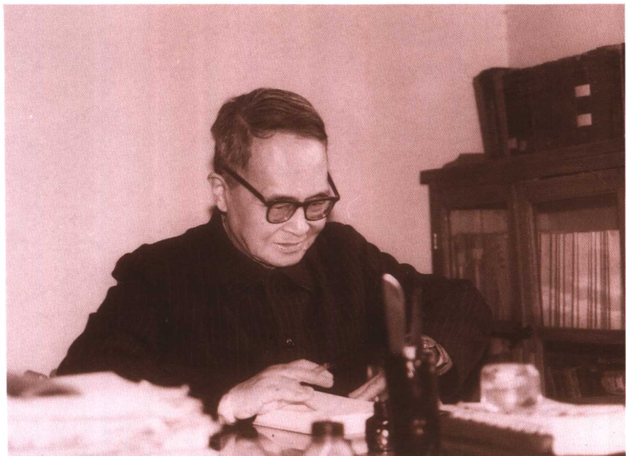
● 八十年代钱鍾书在南沙沟家中