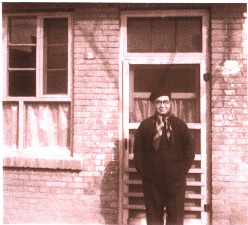
●五十年代三校合并时钱鍾书在中关村家门口