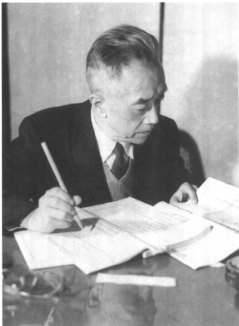
1960年胡适摄于台中故宫博物院。