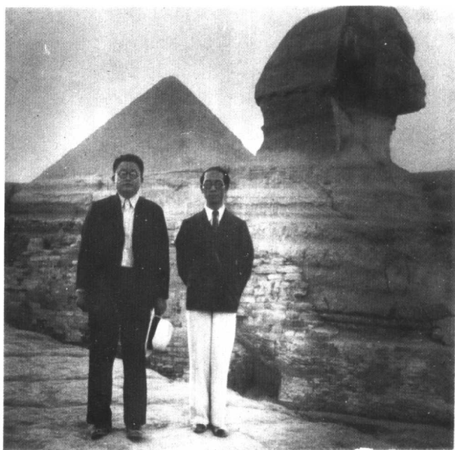
1938年7月，陶行知在埃及开罗狮身人面像前与友人留影