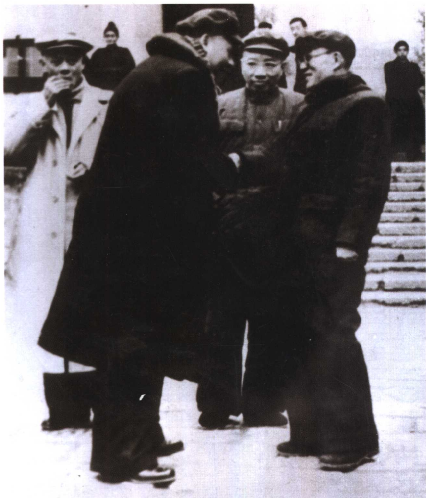
1952年刘少奇视察湖南大学与李达握手，中为时任长沙市委书记的曹瑛