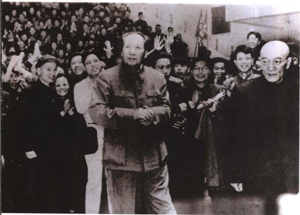
1958年4月6日，李达陪同毛泽东接见武汉科技界人士