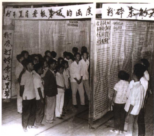
“文革”中批判李达的大字报专栏之一。