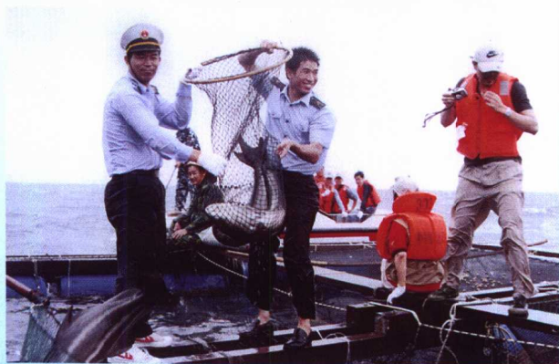
在南沙美济礁养殖实验成功