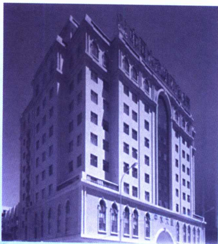
中国水产（集团）总公司

中国水产（集团）总公司成立于1984年，是中国最具实力的综合性国有大型水产企业，是国务院确定的100家建立现代企业制度试点单位、120家大型企业集团试点和520户国家重点企业之一，是农业部、国家计委等8部（委）确定的农业产业化龙头企业。集团拥有进出口经营权、投资项目审批权、对外经济技术合作权、外事外经审批权等。由集团公司控股的“中水渔业”已成功上市，显示出集团的整体实力和活力。中水集团紧紧抓住远洋渔业这个龙头，勇于开拓，坚持不懈，走出了一条国有大型水产企业持续发展的新路子，现已成为水产主业突出、功能配套、跨国经营、业绩良好，在国内外渔业界享有一定知名度的大型企业集团。集团现有50多家全资、控股子公司和驻外机构，国内企业员工3万多人，海外企业员工包括外籍员工8000余人，主要从事海洋捕捞，水产加工、贸易，渔船、渔机、钢丝绳、网具制造，港口建筑，国际经济技术合作和劳务输出等。业务主要分布在三大洋沿岸30多个国家和地区，被称为在全球作业的“日不落”公司。