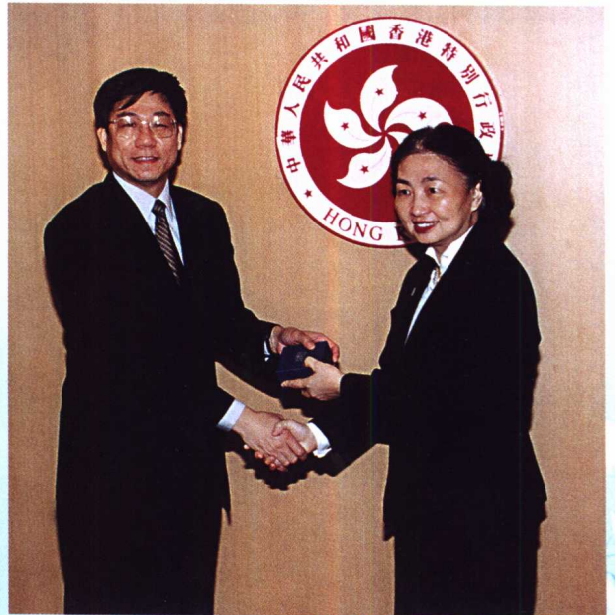
应香港特别行政区政府邀请，农业部渔业局局长杨坚于2001年12月9日至14日对香港特别行政区进行正式访问。图为杨坚局长拜会律政司司长梁爱诗女士