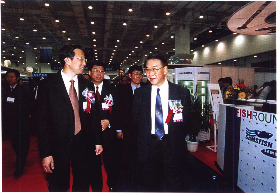
全国人大农业与农村工作委员会主任高德占（右一）与农业部常务副部长韩长赋（左二）参观渔业博览会