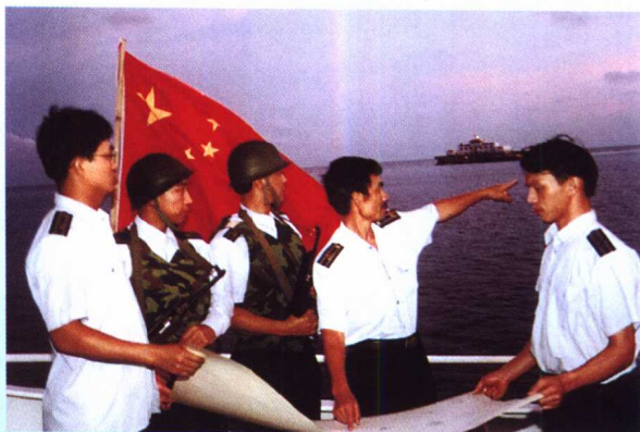
渔政船长年为南沙渔业开发保驾护航