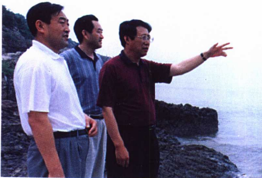
大连市海洋与渔业局领导 在研究和规划渔业现代化建设