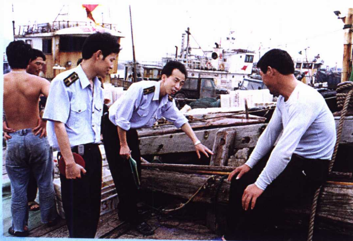
开展安全检查，确保安全生产