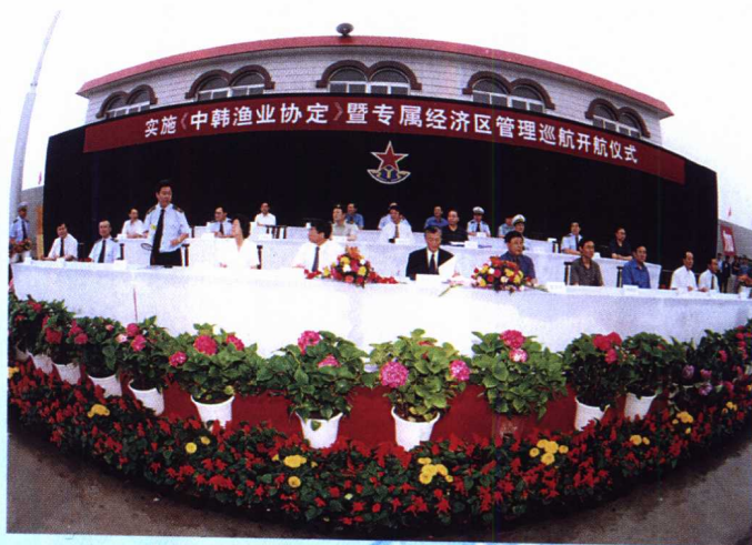
《中韩渔业协定》暨专属经济区管理巡航仪式