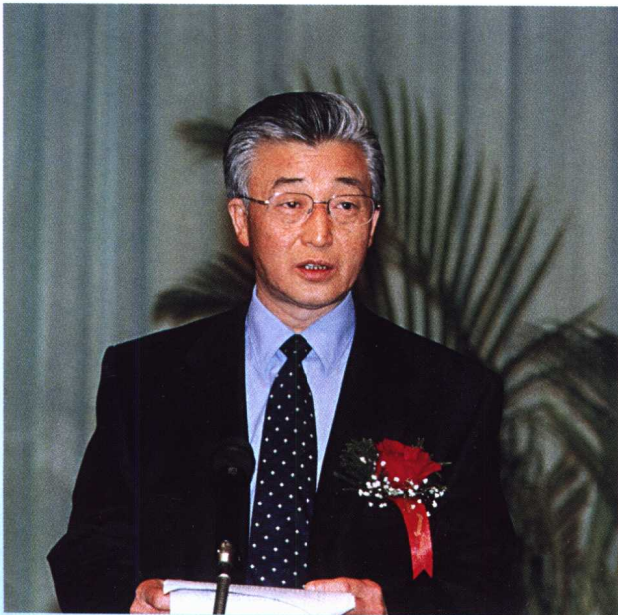
农业部副部长齐景发出席中国水产学会第七次全国会员代表大会，并发表讲话