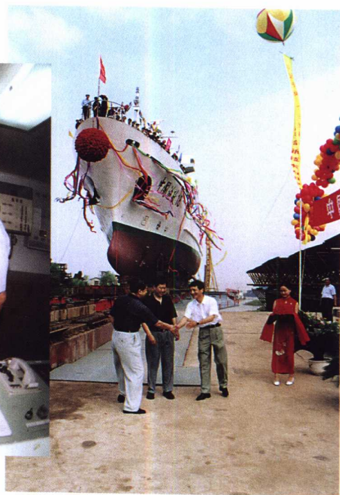
中国渔政118号船在武昌造船厂举行下水仪式