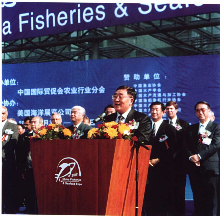
全国政协副主席李贵鲜 在2001年中国国际渔业博览 会上致辞