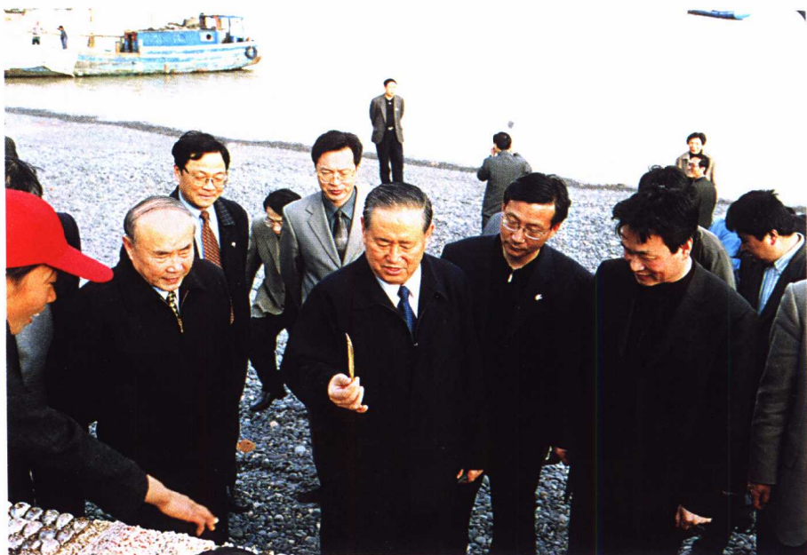
姜春云副委员长在浙江视察渔业法执行情况