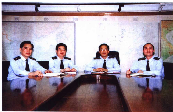
南海区渔政渔港监督管理局领导班子成员