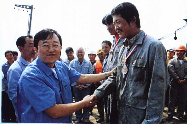
在大洋上向钓鱼能手颁发奖牌