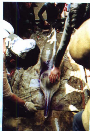
保护水生野生动物，抢救白鳍豚