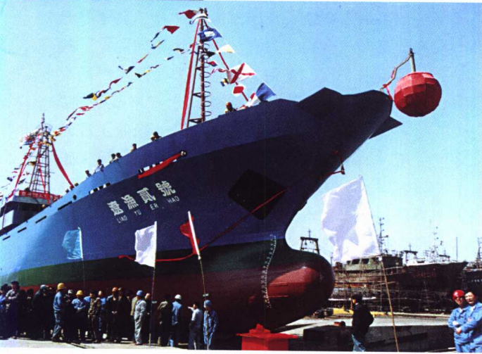
自行建造的大型远洋鱿鱼钓轮