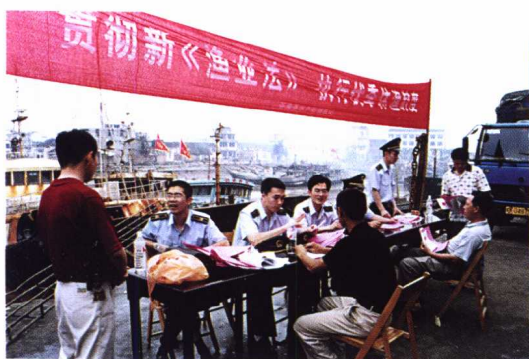
伏季休渔，加大管理力度，确保渔业可持续发展