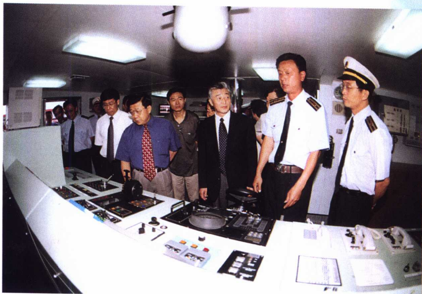
农业部副部长齐景发、山东省副省长赵克志等领导同志 在中国渔政118号船上检查工作