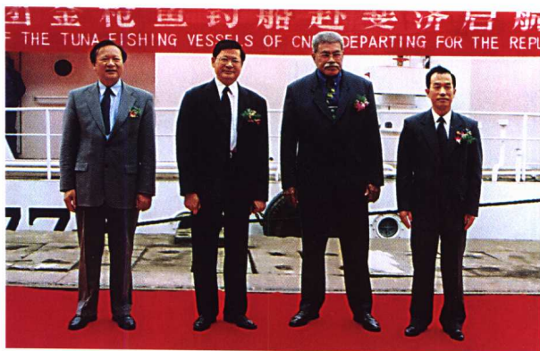
刘身利总经理与斐济总理莱塞尼亚·恩加拉塞 出席中水集团金枪鱼钓船赴斐济启航仪式