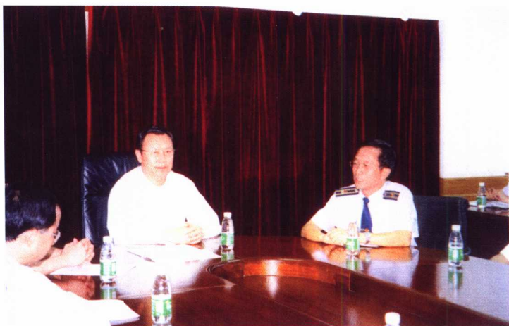
农业部副部长杜青林在南海区渔政渔港监督管理局检查、指导工作