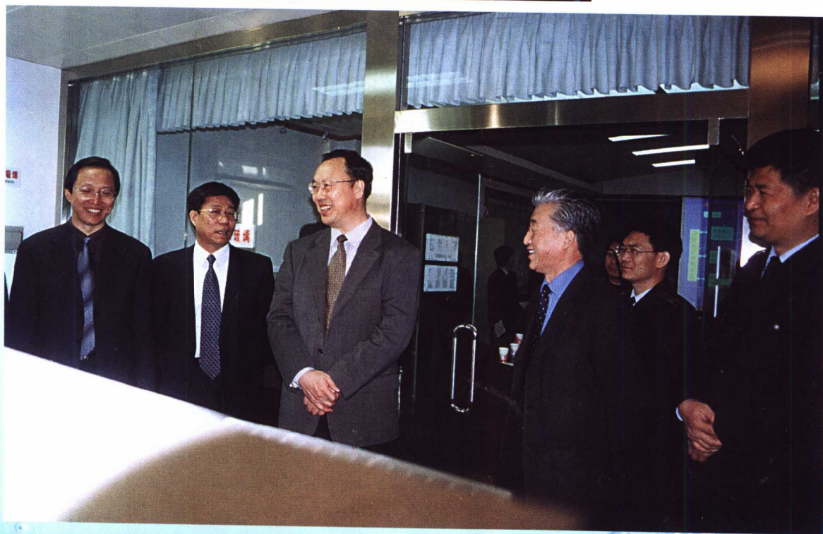
农业部部长杜青林(左三)、副部长韩长赋(左一)和齐景发(左四)参观中国渔政指挥中心机房