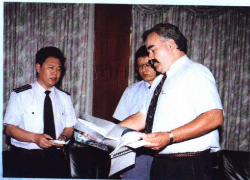
美国海岸警备队官员到黄渤海区渔政渔港监督管理局参 观访问