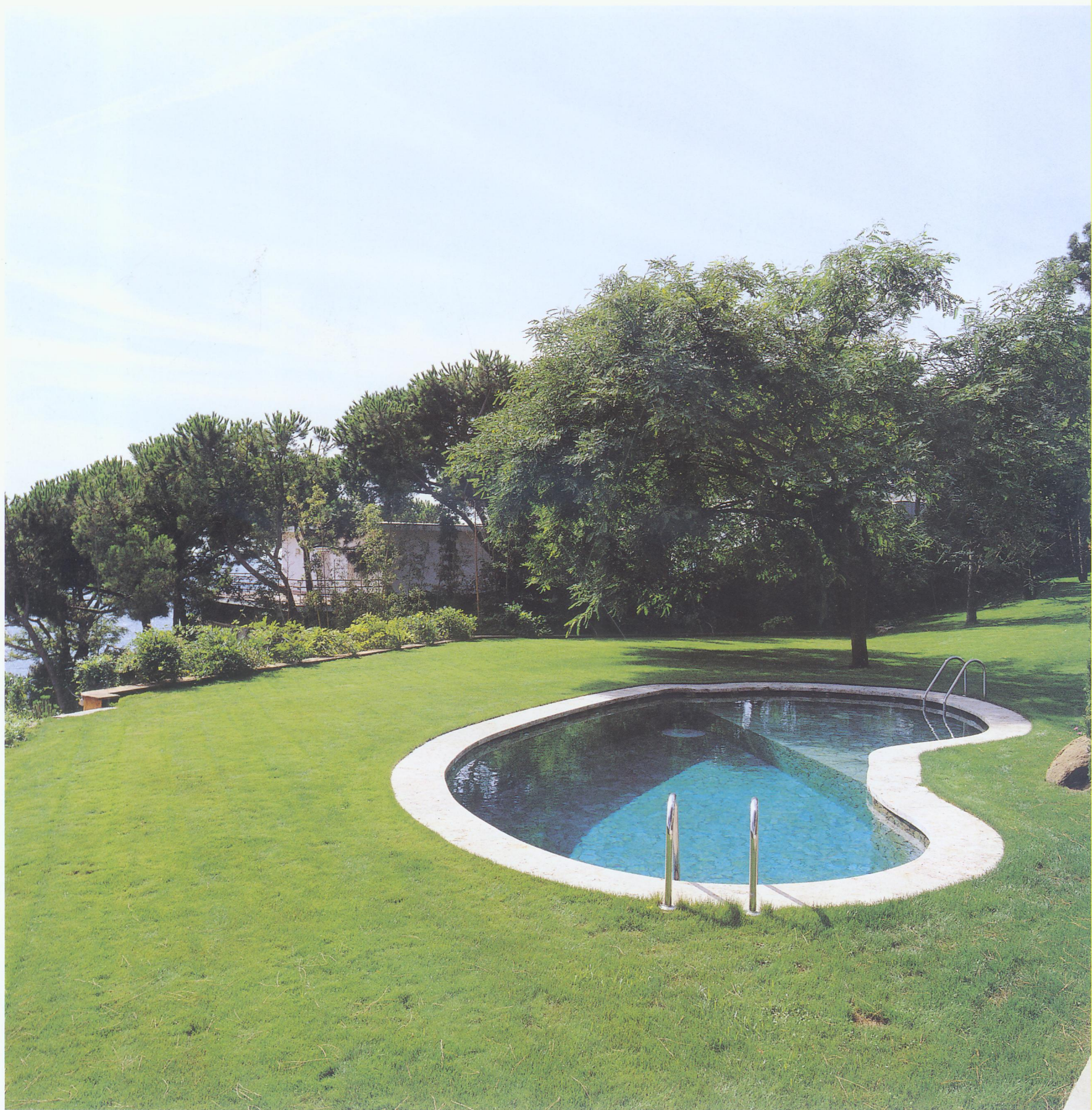
弯弯曲曲的游泳池与花园融合得天衣无缝。