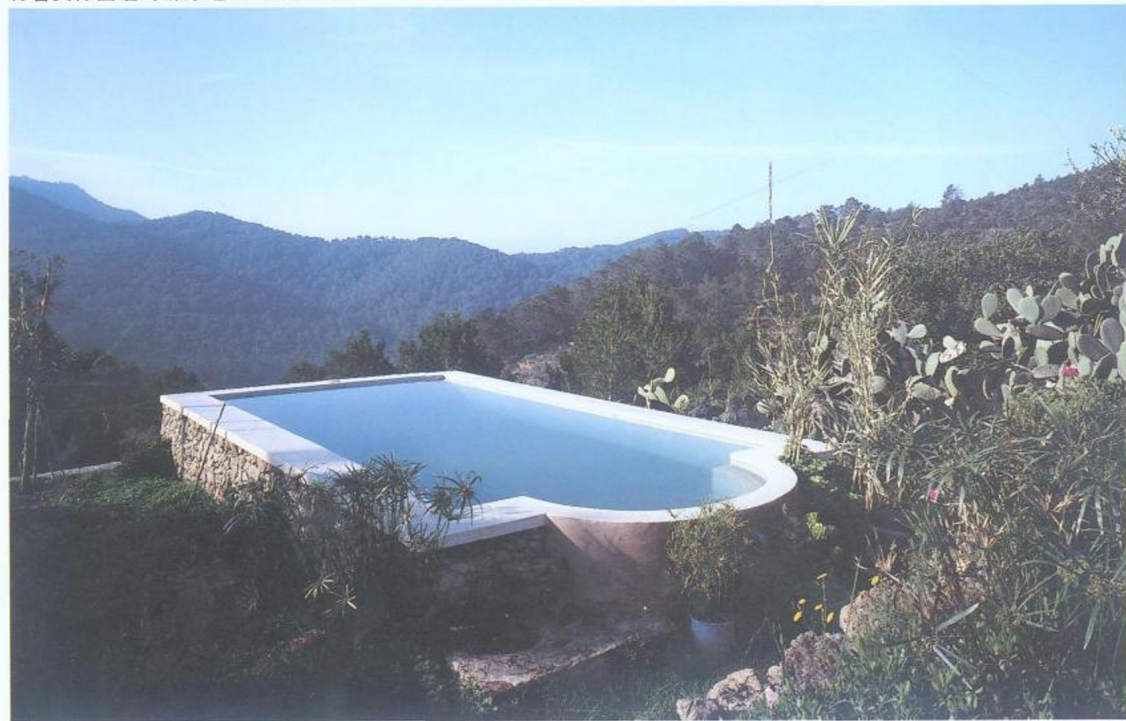
有着实体围墙的游泳池从地面升起。

站在有木梁的门廊下，我们可以远眺山谷。这里没有排列整齐的农田。森林中部的美存在于树枝下的阴凉和寂静。