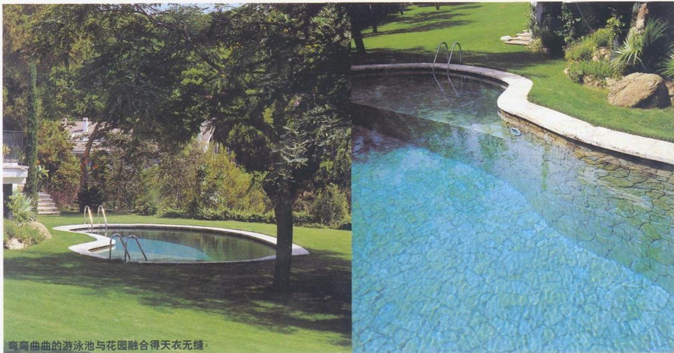
弯弯曲曲的游泳池与花园融合得天衣无缝。

游泳区与住宅的距离也颇为理想，要到房子里拿衣服和其它物品时感觉距离足够近，同时，在游泳时又有足够远的距离能保证私密性和安静。