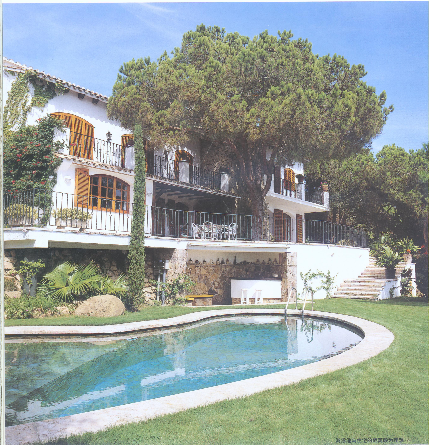
游泳池与住宅的距离颇为理想