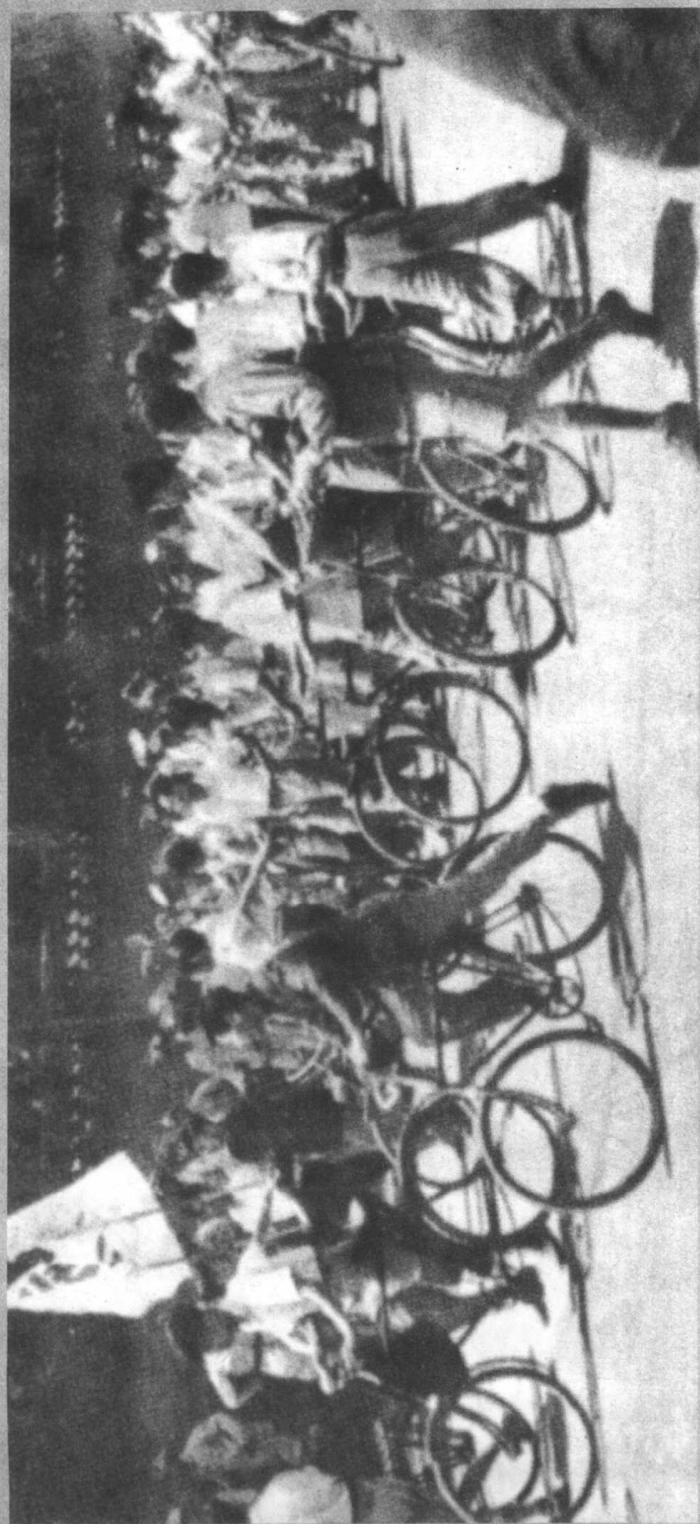
北平大学生冲破军警封锁线，举行示威游行，反对国民党暴行。