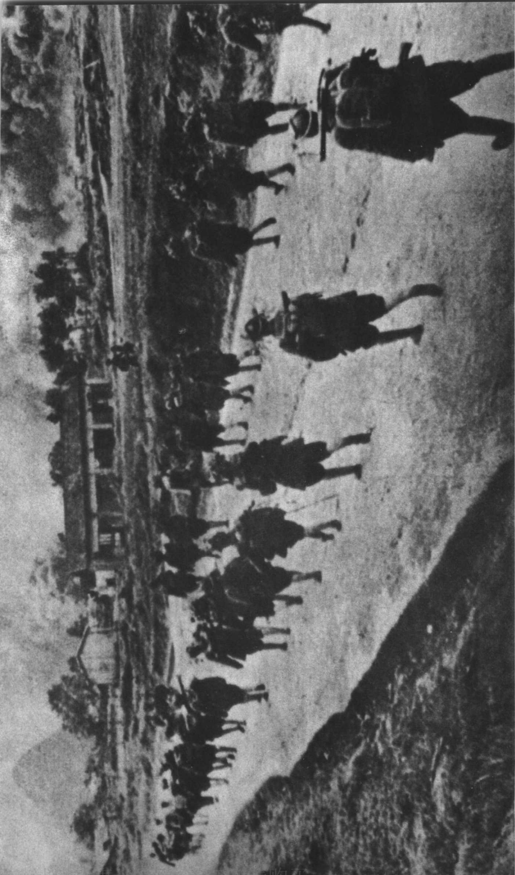
国民党军由桂林溃退时，放火烧毁了电信局。我军抵达市郊时，仍烟雾弥漫。