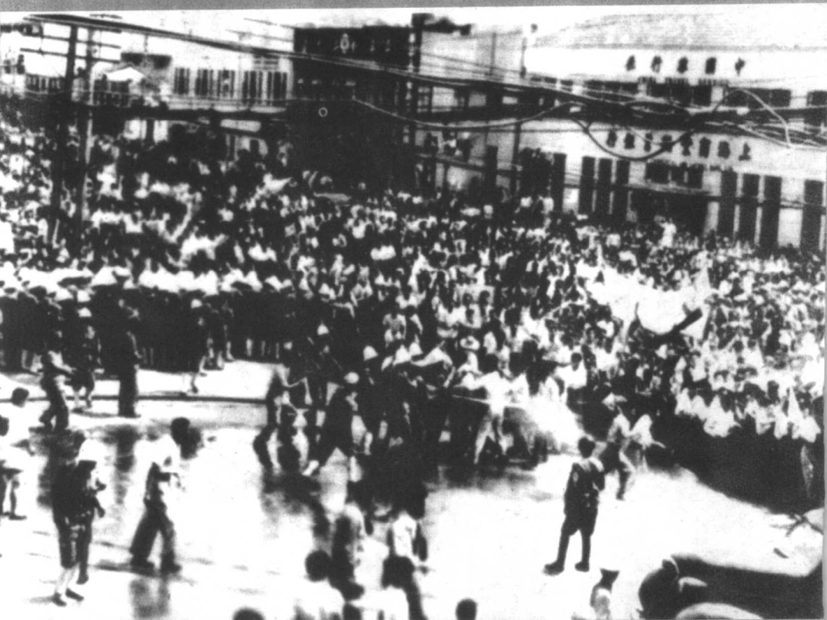
上海学生在示威游行时遭到军警镇压