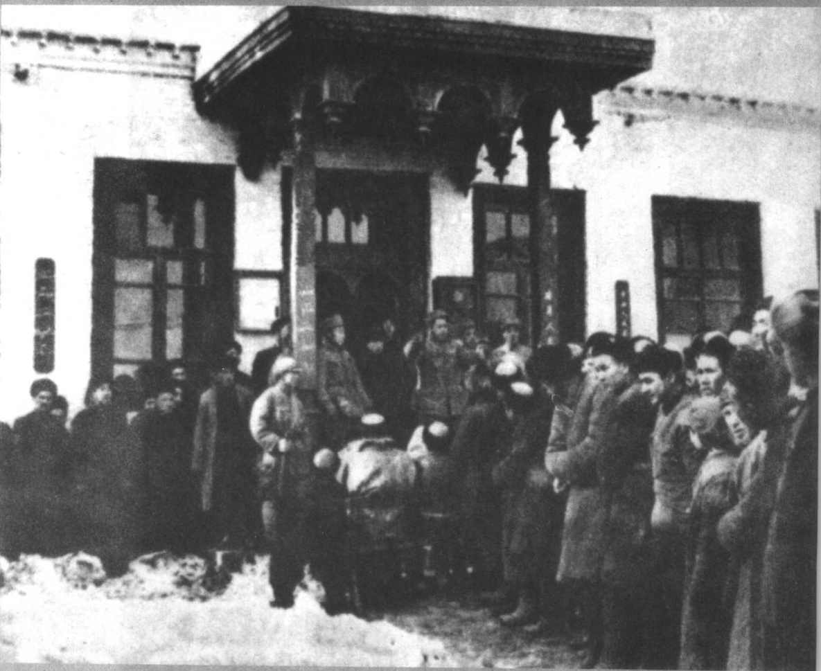
国民党在新疆南部和田杀害了许多革命青年。这是1949年12月23日和田解放后，县委书记向人民揭露敌人暴行。