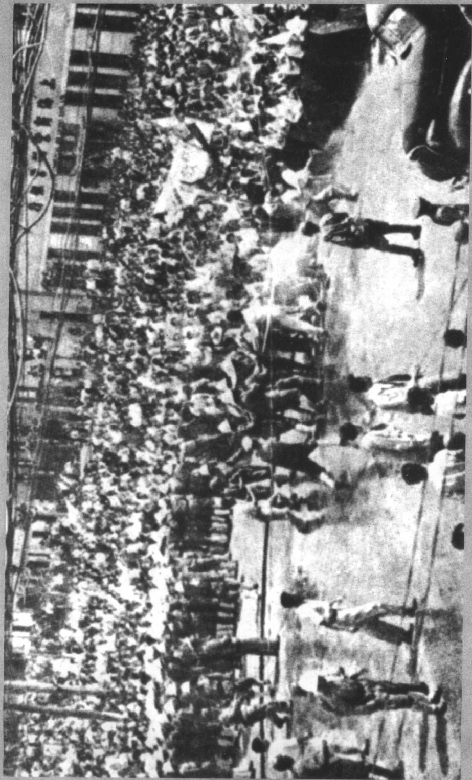
南京学生上街游行，向国民党政府请愿。此图为学生与警察抢夺水龙头情形。