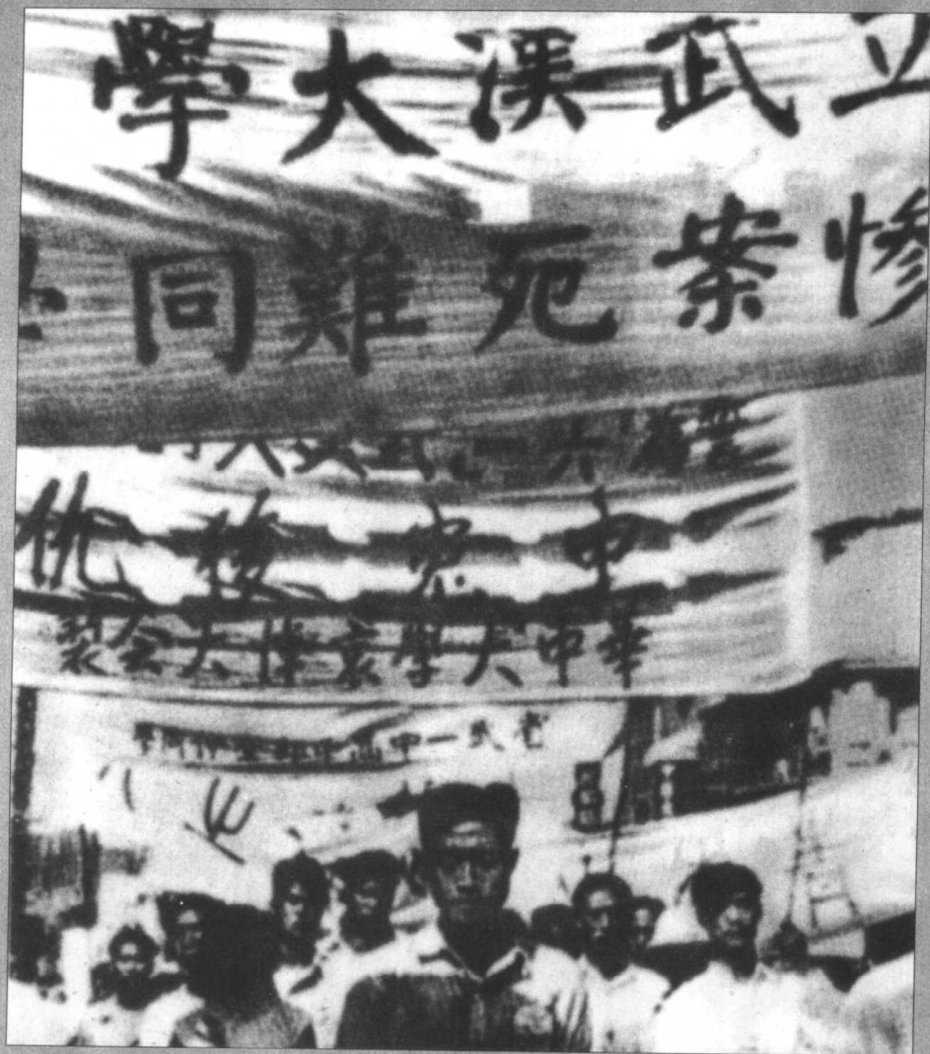
武汉学生举行示威游行，抗议国民党政府屠杀学生的暴行。