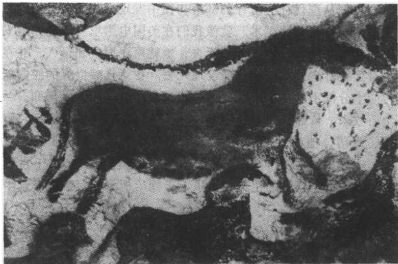
3. 拉斯科洞穴的马饰带