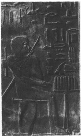
8. 佐塞王首相供桌前的浮雕

一般人是难以看见的。在上古时代,统治者在死后往往让自己的奴仆陪葬,让他们跟随死者进入冥界,继续为自己服务。这种残酷的习俗,在中国的历史上也是不难找到有关记载的。到后来,也许奴隶主们觉得这是一种生产资源的巨大浪费,他们改变做法,把仆役和侍臣的图像画入墓穴,以此种方式让仆役们陪伴其进入另一个世界。从某种意义上说,艺术推动了人类文明的进步。