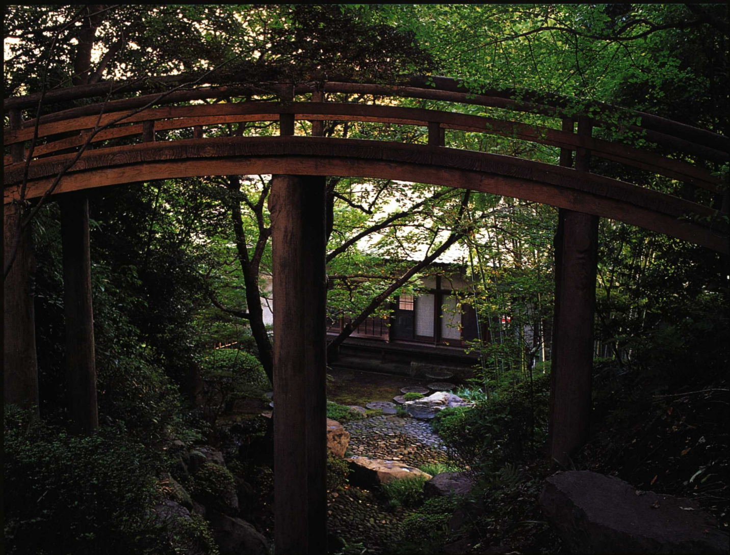
上图：兼好寺的花园