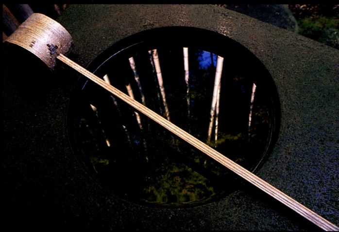
上图：兼好寺的水钵 对面页上图：秋收之后 对面页下图：春天的稻田