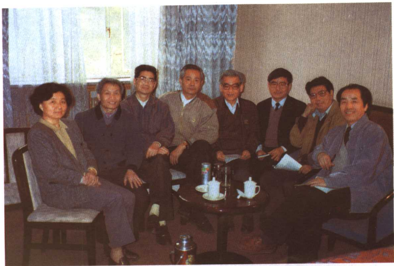
同制订高中语文教学大纲同志们 (1995)