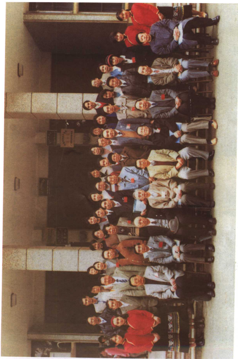
全国语言教育问题座谈会代表合影（1997，广西民族学院）