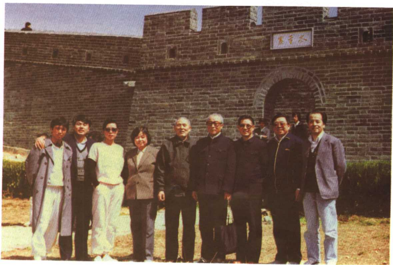
同人教社中语室同志们 (1987)