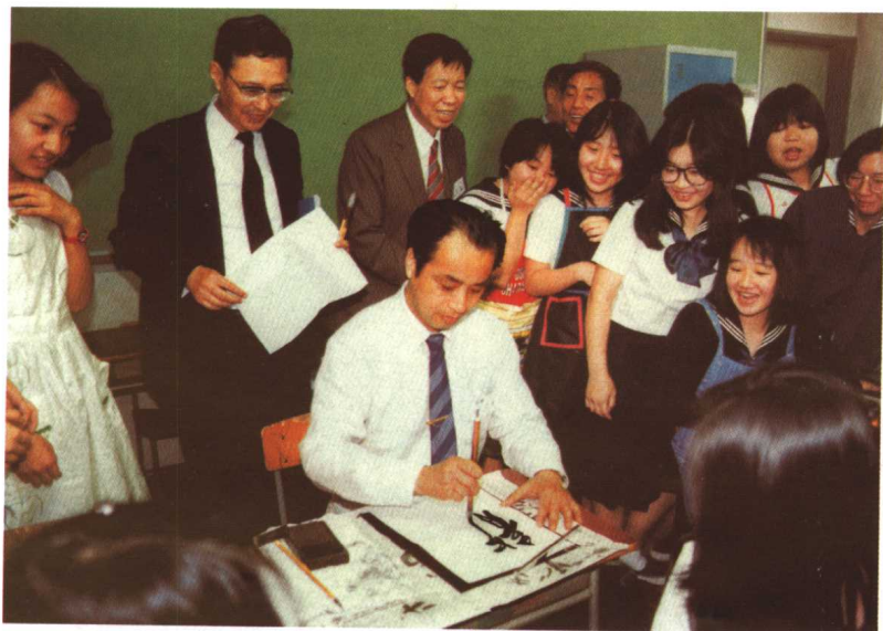
访问日本东京女学馆 (1987)