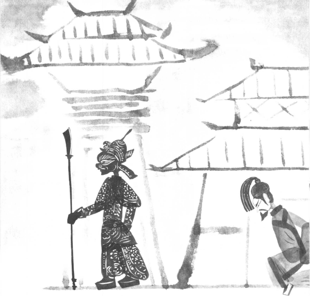
千古奇冤，洛阳丁管。