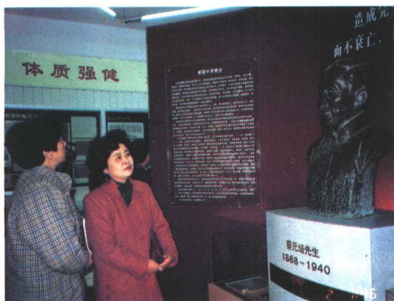
爱国中学爱国主义教育基地展示厅对学生家长开放