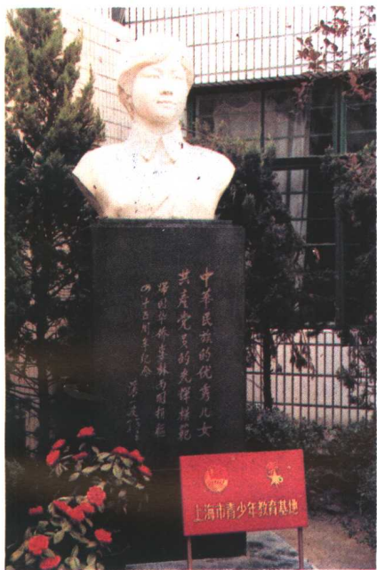
1990、1995年爱国中学分别被上海市团委、静安区人民政府命名为“青少年教育基地”