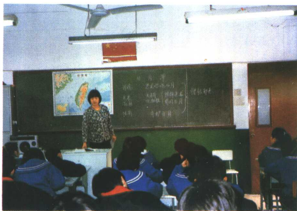
爱国中学语文教师依据爱国主义教育促进内化教学模式进行教学实践