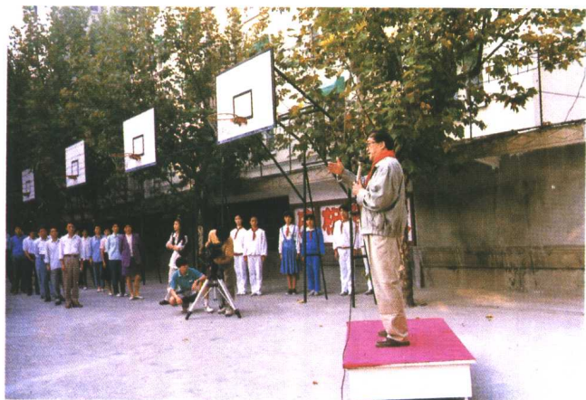
著名导演谢晋在爱国中学升旗仪式上作纪念鸦片战争一百周年主题演讲