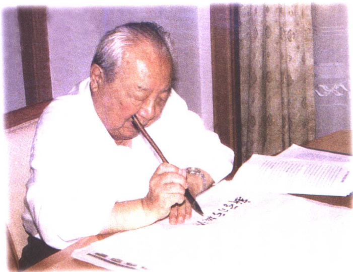
费孝通先生为本书题写书名