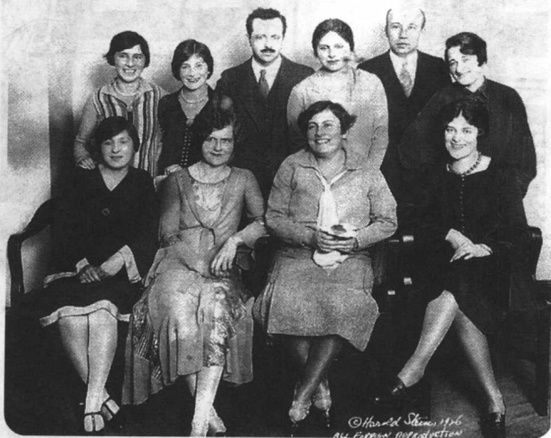
伯奈斯与多莉丝及其公关办公室人员合影于1926年，亦即 他开展其事业的第七年。