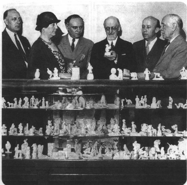
肥皂雕刻大赛的评委正聚精会神地评比参赛作品。这项比赛一直维持了37年，每年用掉100万块肥皂，吸引了成千上万，年龄从6岁到86岁的男女老幼。