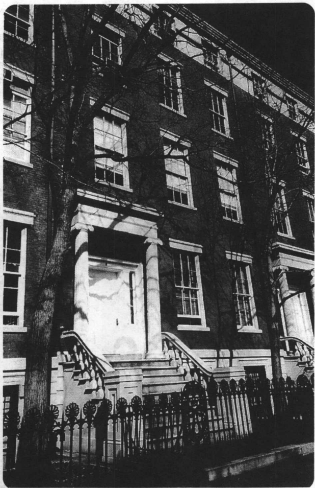
伯奈斯与多莉丝第一个真正的家，坐落于北华盛顿广场八号。