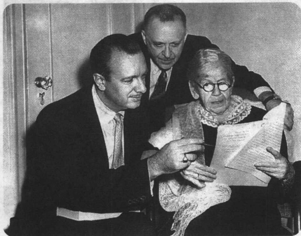
伯奈斯(左)、CBS记者华特·克朗凯与伯奈斯的母亲安娜·弗洛伊德·伯奈斯一同讨论克朗凯即将播报的有关西格蒙·弗洛伊德的报导。安娜时年已逾90岁。