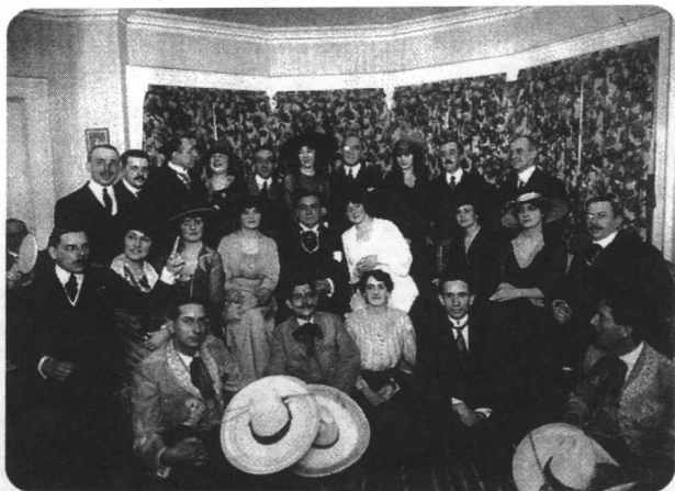
伯奈斯处理戴亚里夫率领的俄罗斯芭蕾舞团首次巡回美国演出的公关事宜。该次演出系由大都会歌剧公司赞助，此帧照片摄于1916年。