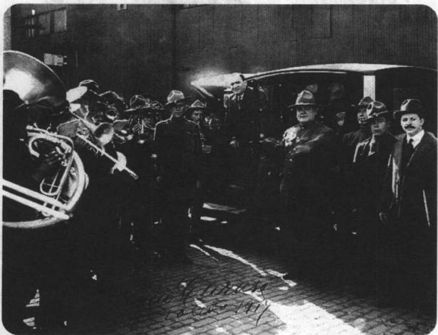
1917年歌王卡罗素于托立都演出时，受到军方鼓号乐队的欢迎。仪式中还安排了一位体形近似卡罗素的步兵替他开车门。一手安排这些噱头的伯奈斯手持新闻资料夹站在照片最右侧。