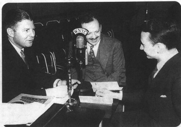
伯奈斯在1930年代参与成立“听觉艺术收音机协会”以促进菲尔科广电公司。图为伯奈斯在一家纽约电台接受访问。