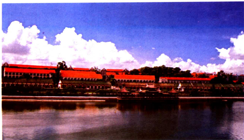
华侨大学华文学院外景