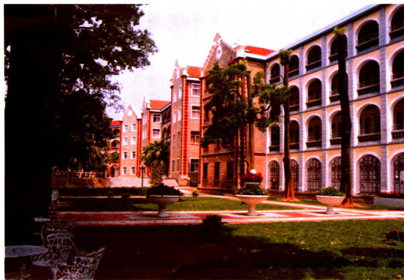
华侨大学华文学院校园一角