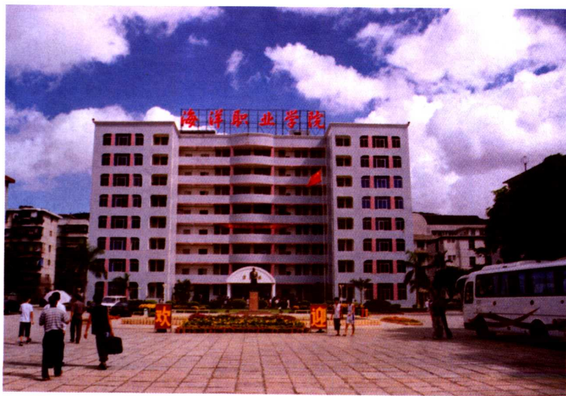
厦门海洋职业技术学院综合楼