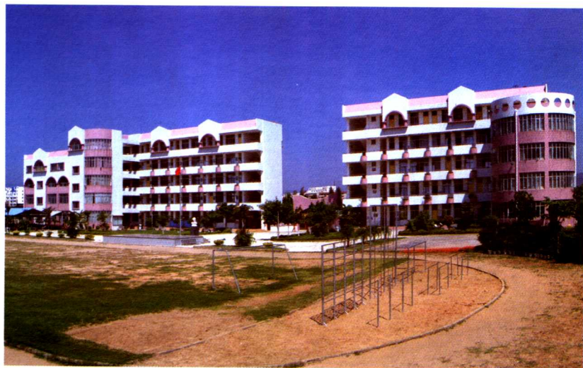
集美第二小学外景