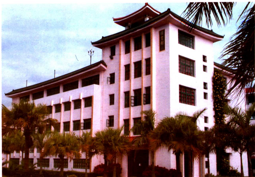
集美轻工业学校图书馆