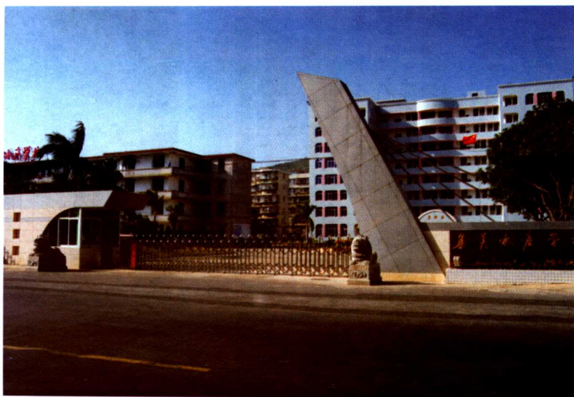
集美水产学校（今厦门海洋职业技术学院）校门