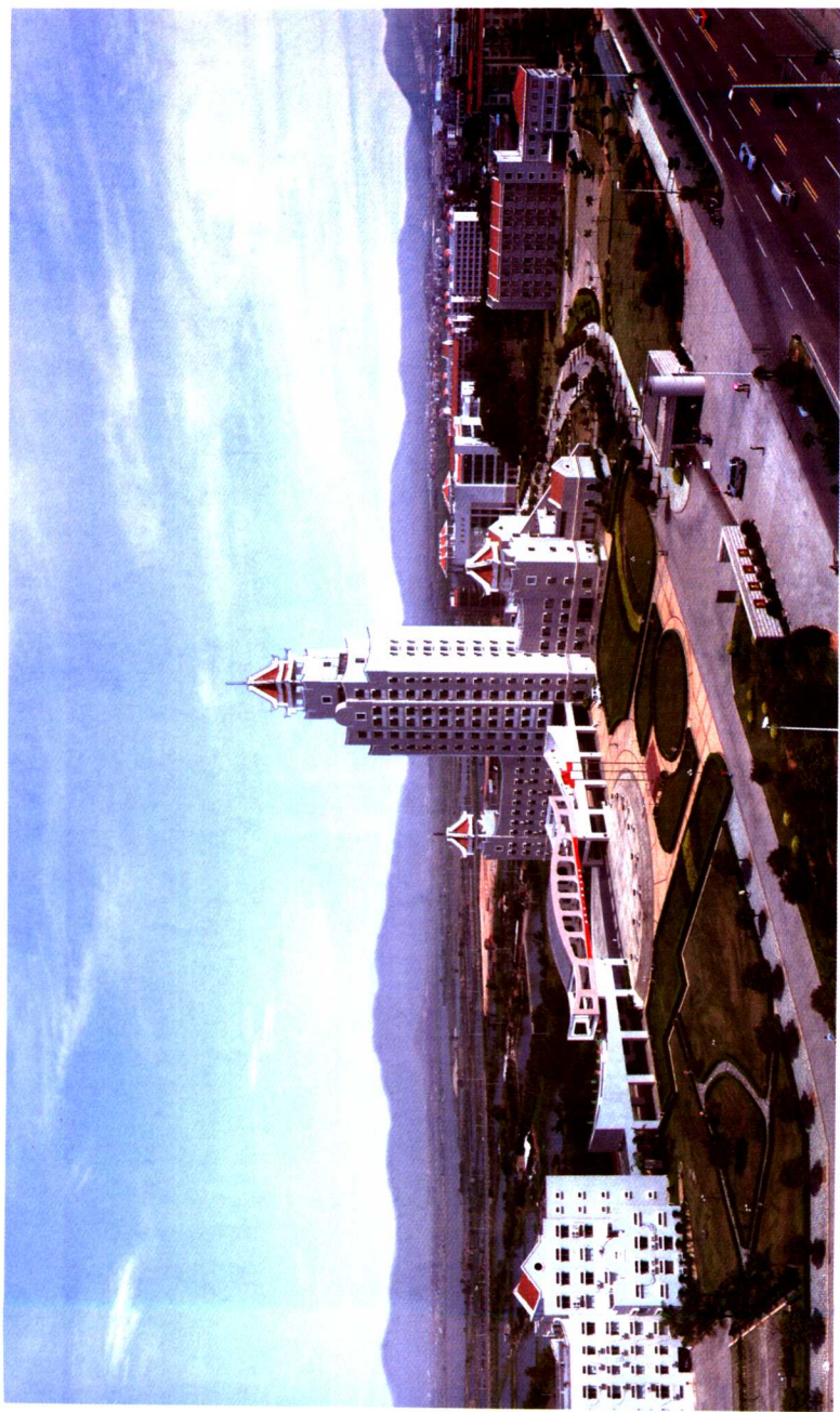
集美大学校部鸟瞰