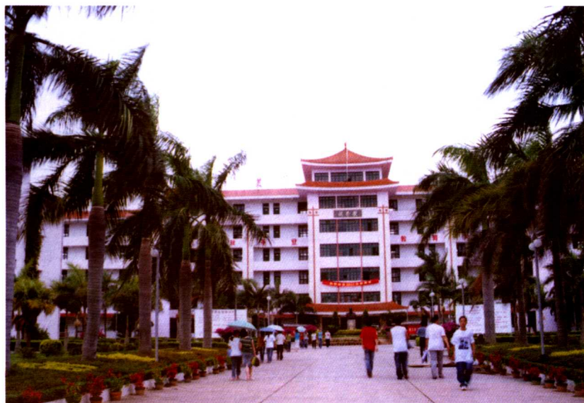
集美轻工业学校校园