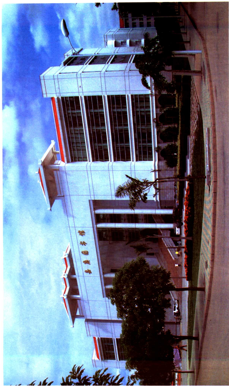
集美大学嘉庚图书馆