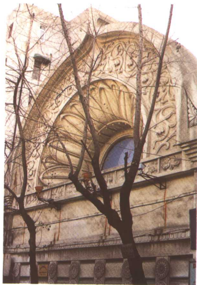
日本式建筑（乍浦路）