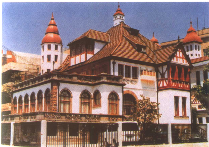
德国式建筑（淮海中路）