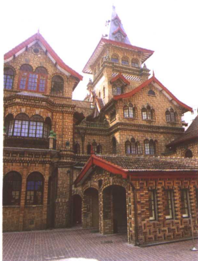
西班牙式建筑（淮海中路上方花园） 北欧式建筑（陕西南路） 英国式建筑（虹桥路）