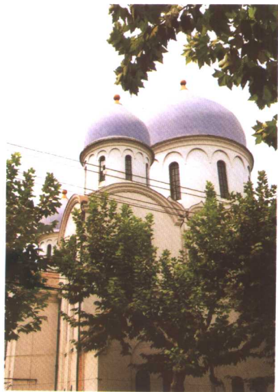
拜占廷式建筑（新乐路）