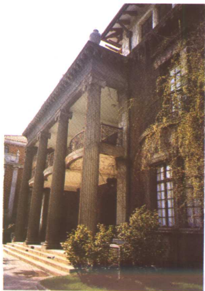
东南亚殖民地式建筑（多伦路）