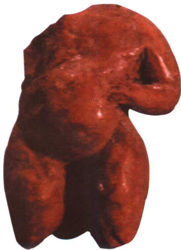
牛河梁子遗址出土的红山文化女神残像