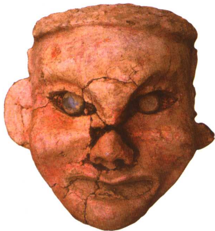
红山文化陶塑女神像