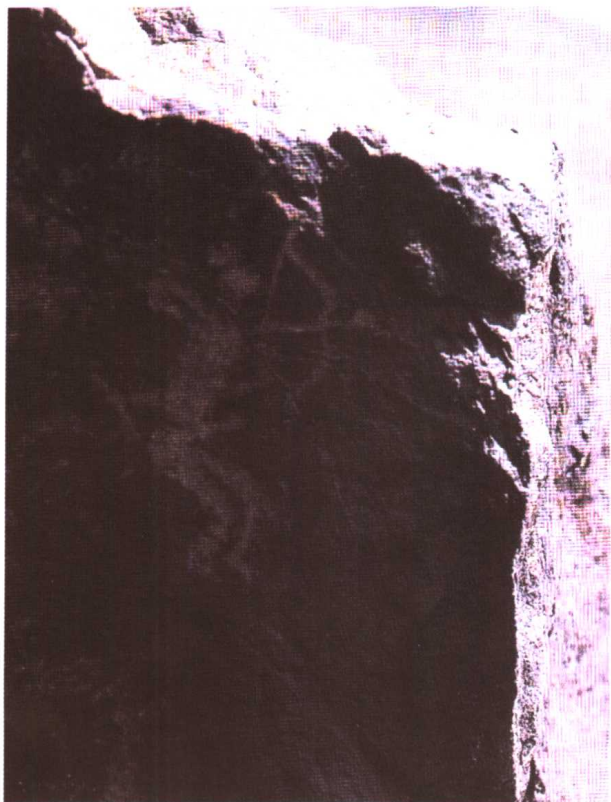
内蒙古乌兰察布岩画