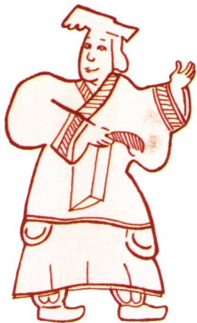
山东嘉祥武氏石室汉画像石上的黄帝像