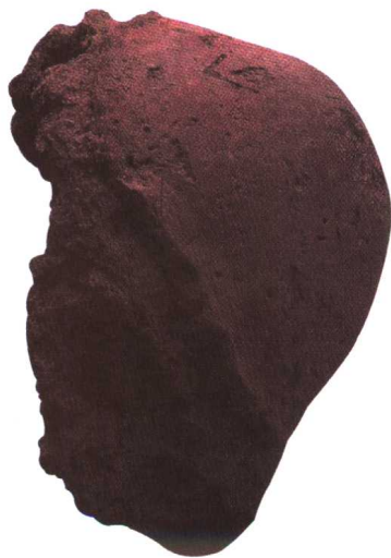
牛河梁子遗址出土的红山文化女神乳房残像