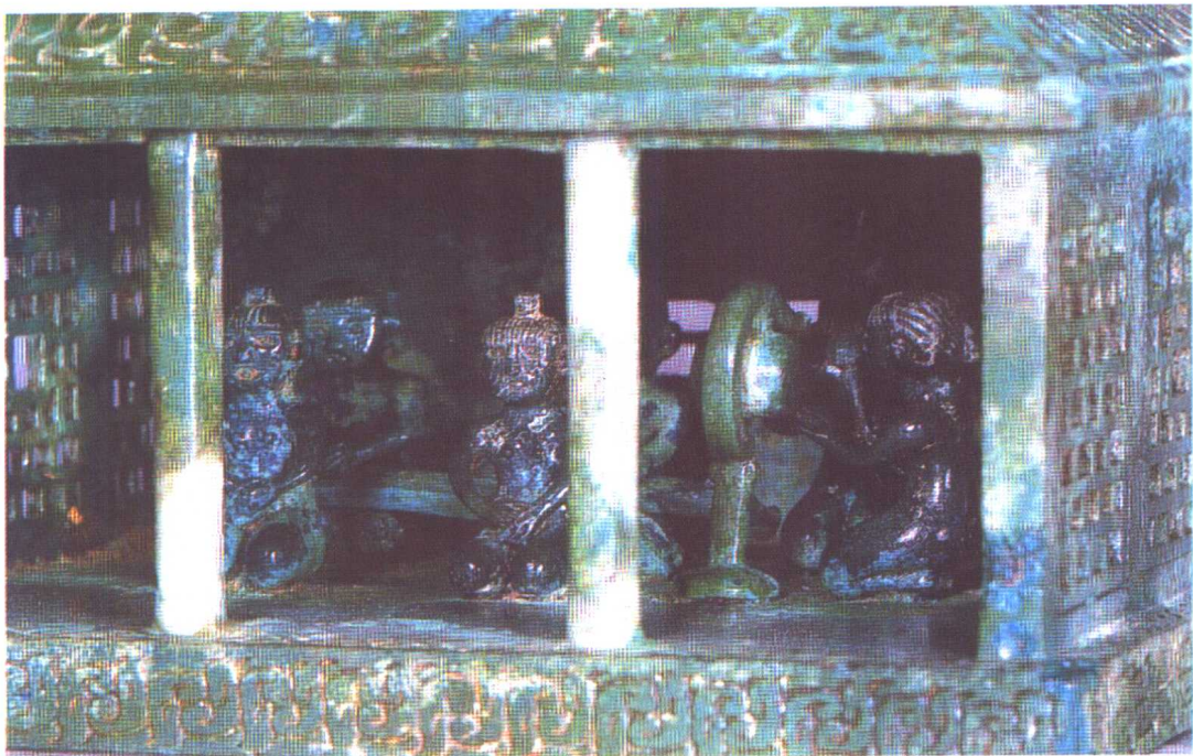
浙江出土青铜房屋模型中的裸体乐人

在这里出土了一尊与真人大小相同的彩绘泥塑“女神”头像与一些泥塑的神像碎块。将这些碎块拼合以后，呈现出一个体态丰硕，乳房饱满的裸体女性形象。她有力地向我们展现出了5000年前那没有衣服的社会。另外，在浙江出土过一件大约3000年前的青铜制造的房屋模型，房屋中，有一组乐人在表演音乐。他们全都是赤身裸体，正像古人记载生活在这里的越人是裸体文身那样，它说明在南方，古人裸体的习惯持续得更长。