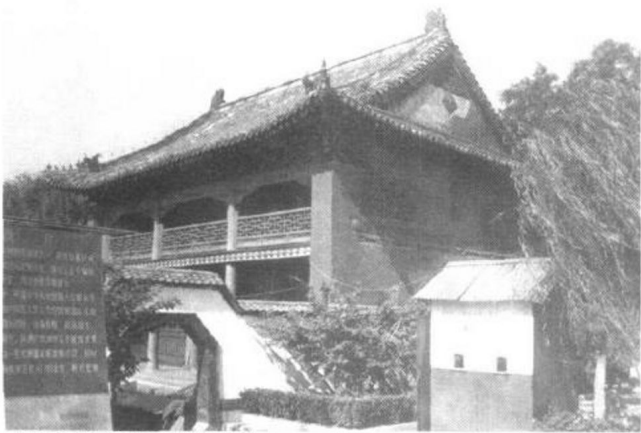
▲趵突泉吕祖庙“娥姜殿”

古时为祭祀舜帝的两个妃子而在趵突泉旁建娥姜祠，宋代又曾在此修历山、泺源二堂，元代在此建吕仙阁。原建筑均已不存在，今有的建筑是由泺源堂、娥姜殿和三大殿三座建筑组成两进院落的清代重修的建筑群。最北面是硬山黑瓦的单层建筑三大殿。中间的娥姜殿是一座两层外廊式的楼阁建筑，歇山屋顶上施以绿琉璃瓦，殿东西山墙上镶嵌琉璃卷草纹样，形式多变，做工精细。南面是两层楼阁式建筑泺源堂，原称吕仙阁，1957年重修时改今名。门两侧有对联：“云雾润蒸华不注，波涛声震大明湖”，取