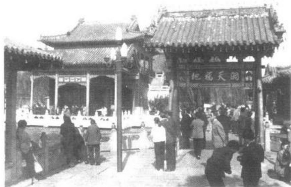
▲趵突泉“蓬莱旧迹”枋(北额，南额为“洞天福地”)

趵突泉，古为泺水之源，名列济南七十二名泉之首，有“天下第一名泉”之美誉。1956年这里辟为趵突泉公园，位于济南市中心，泺源大街路北，东为泉城广场，北与五龙潭公园隔路相望。