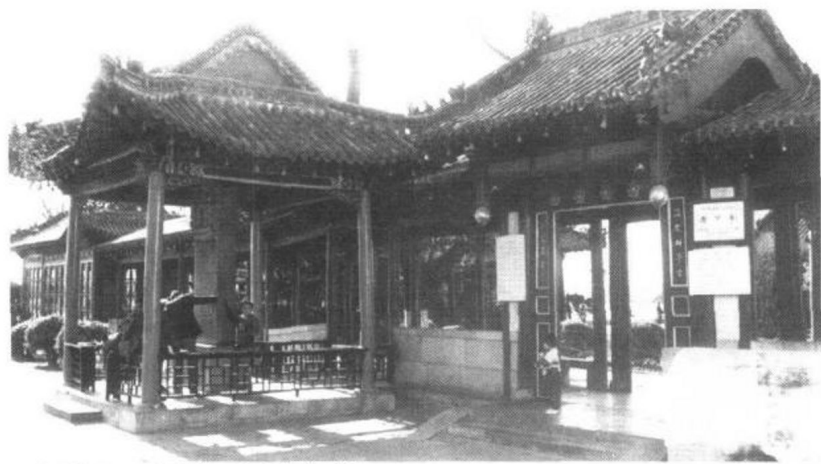
▲大明湖历下亭垂花门和乾隆御碑亭

位于大明湖北岸西端的铁公祠，南临碧波荡漾的湖面，四周廊墙相围，内有假山池塘，花木扶疏，自成院落，是大明湖的园中园。祠堂始建于清乾隆五十七年(公元1792年)，是为了纪念明朝山东参政铁铉而建的祠堂。祠内建筑众多，著名的“四面荷花三面柳，一城山色半城湖”对联是大明湖景色的最好写照，镶嵌在长廊圆洞门的两侧。祠内的小沧浪为仿苏州沧浪亭而建的一组园林建筑，园小巧别致，引人入胜，游人至此南眺群山苍翠，近观碧波潋滟，远看水天一色，是欣赏济南八景之一“佛山倒影”的最佳场所。