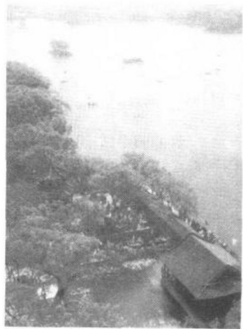
▲大明湖铁公祠小沧浪全景