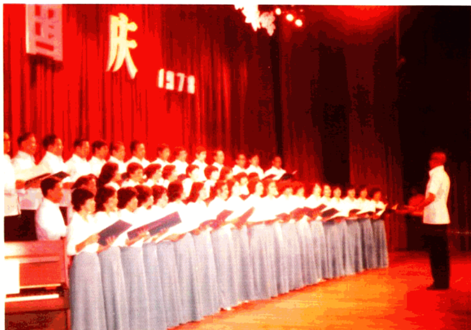
菲華各界慶祝中華人民共和國成立三十周年紀念,菲律賓黃河合唱團參加演唱愛國歌曲。