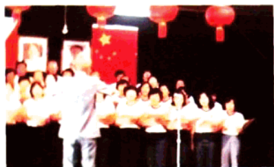
黄河合唱團在東方體育會禮堂舉行演唱會。(1978)