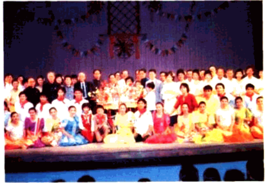
菲律賓黃河合唱團，華藝舞蹈團返國訪問演出後，在泉州梨園劇場與泉州市府諸領導合影留念。(一九八四)