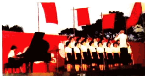
黄河合唱團在菲律賓馬尼拉市倫禮沓廣場演唱時留影。(慶祝中國農曆甲子春節)