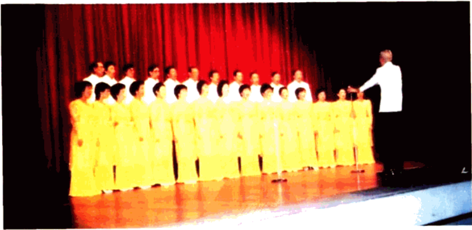
黃河合唱團應中國對外演出公司之邀請，代表菲律賓前往北京福州泉州廈門各市，作中菲文化交流之訪問演出。出國前，先在東方大學音樂廳舉行演唱會，招待中菲人士。(1984)