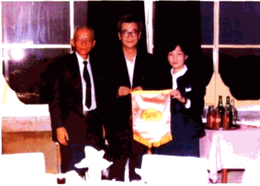
在訪問演出後的歡宴會中，福建省文化廳廳長鄒維之接受由本團名譽團長王炯，團長許麗容代表本團贈送的紀念錦旗。(一九八四)