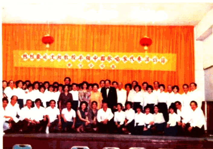
黃河合唱團歡迎沈湘教授率領中國歌唱家訪菲合影