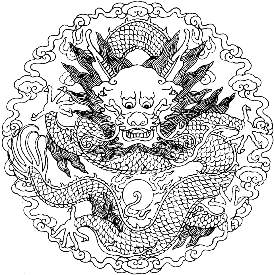
4 坐 龙