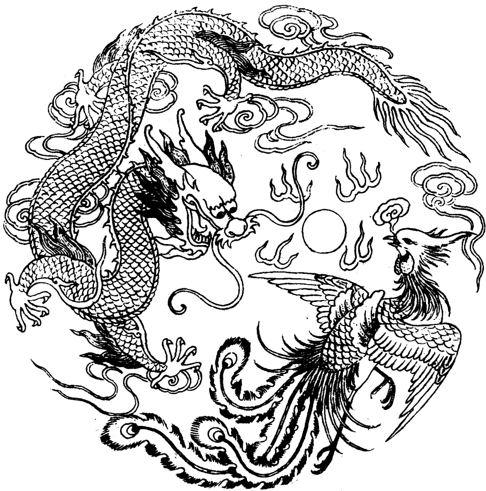
10 龙 凤