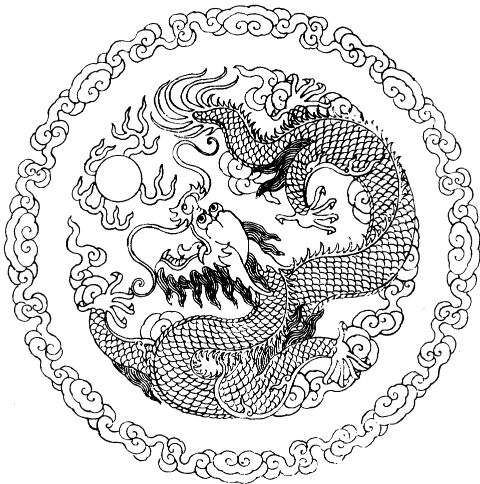
3 云 龙