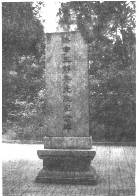
清华大学王国维纪念碑(1995年摄)。碑文为陈寅恪所撰，碑式为梁思成所拟，林志钧书丹，马衡篆额