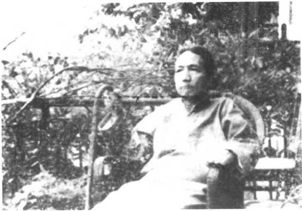
陈寅恪1958年于广州中山大学东南区一号寓所