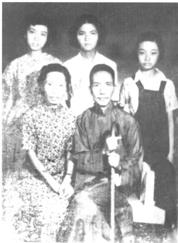
陈寅恪全家1950年夏 于广州合影