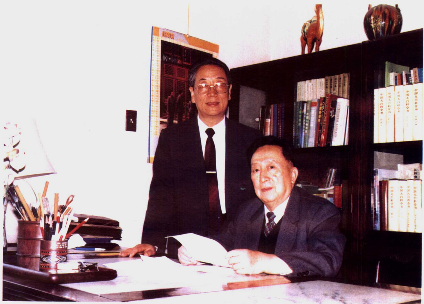
郭应祿 教授 吴阶平 院士