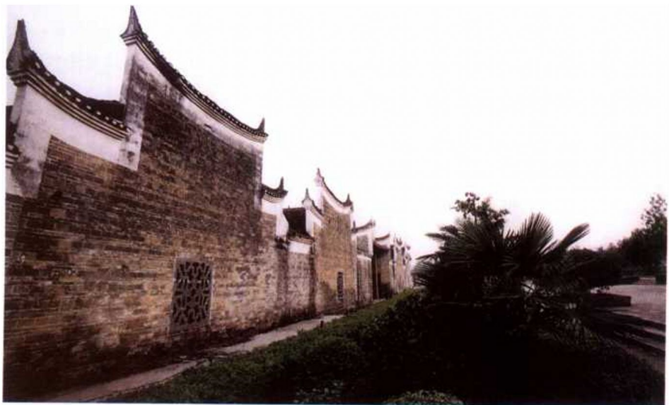
平江起义旧址——天岳书院

小时候，听长辈讲过这样一个故事：古代这里有位老人，在他 80 寿辰时，一道士赠其锦囊，并嘱再过百年，待一位姓刘的高人来后，方可解囊揭秘。岁月匆匆，到这位老人 180 岁华诞时，果然有一位姓刘的前来祝寿。老人遂按道士所嘱，解开锦囊观