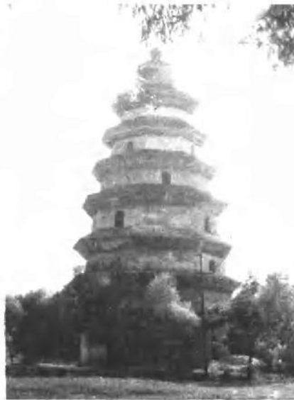
勺湖之畔的文通塔。