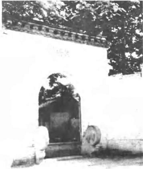
淮安城内东街的关天培祠。