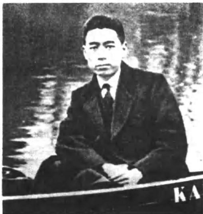
周恩来同志在德国柏林（一九二二年）。