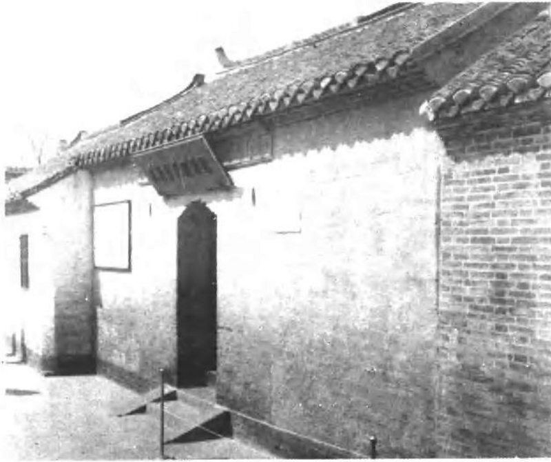
周总理故居的大门(射马巷)。