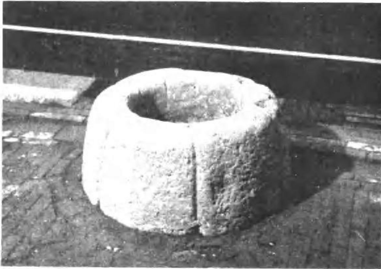
周总理故居的水井。童年时代周恩来同志经常在这里汲水洗菜。