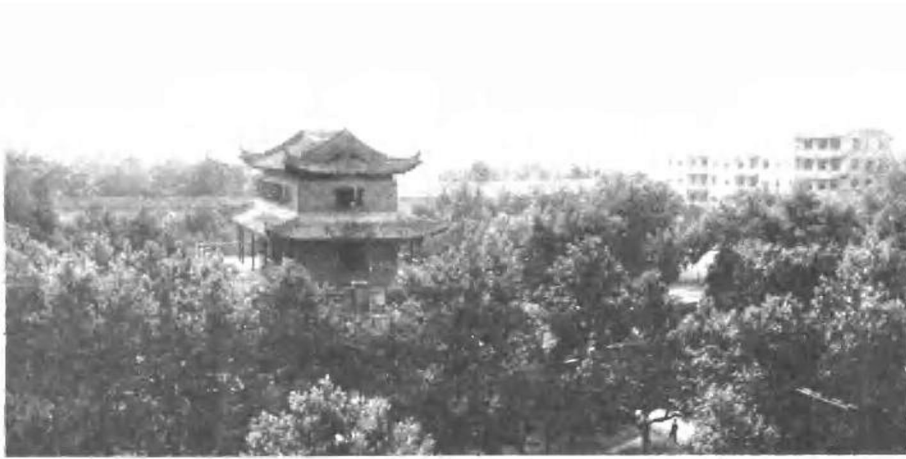
雄踞淮安城中心的宋代建筑镇淮楼。