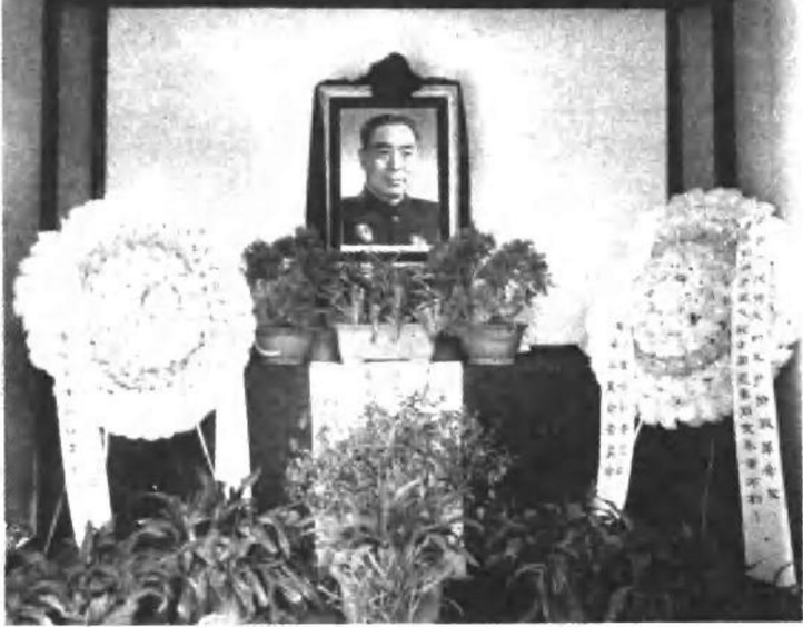
中共淮安县委在周总理故居设立的灵堂。