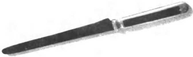
周恩来同志童年时用过的裁纸刀。