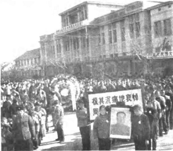
淮安县广大干部、群众，排队到周总理故居举行吊唁活动。