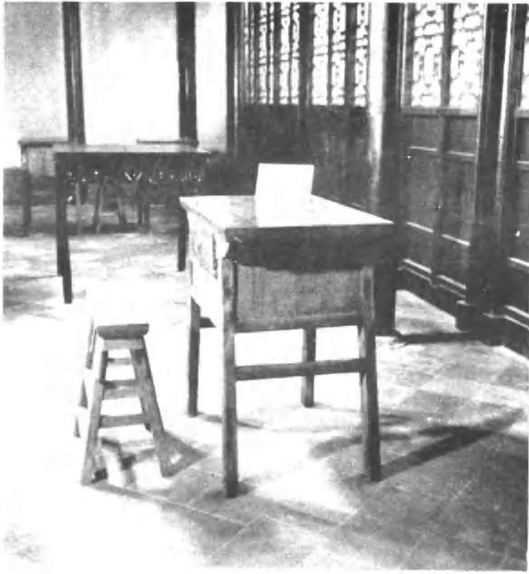
周恩来同志童年在驸马巷读书的地方。