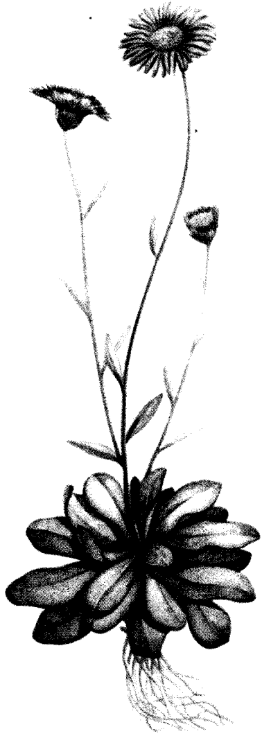
灯 盏 花