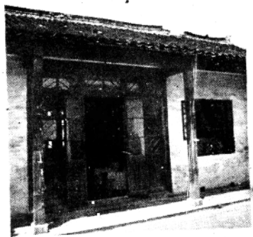
顾颉刚先生故居 (苏州顾家花园4-1号)