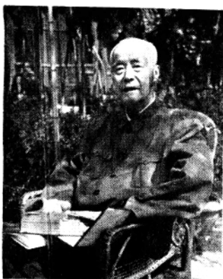
胡胡先生 (1951年摄于北京寓所)