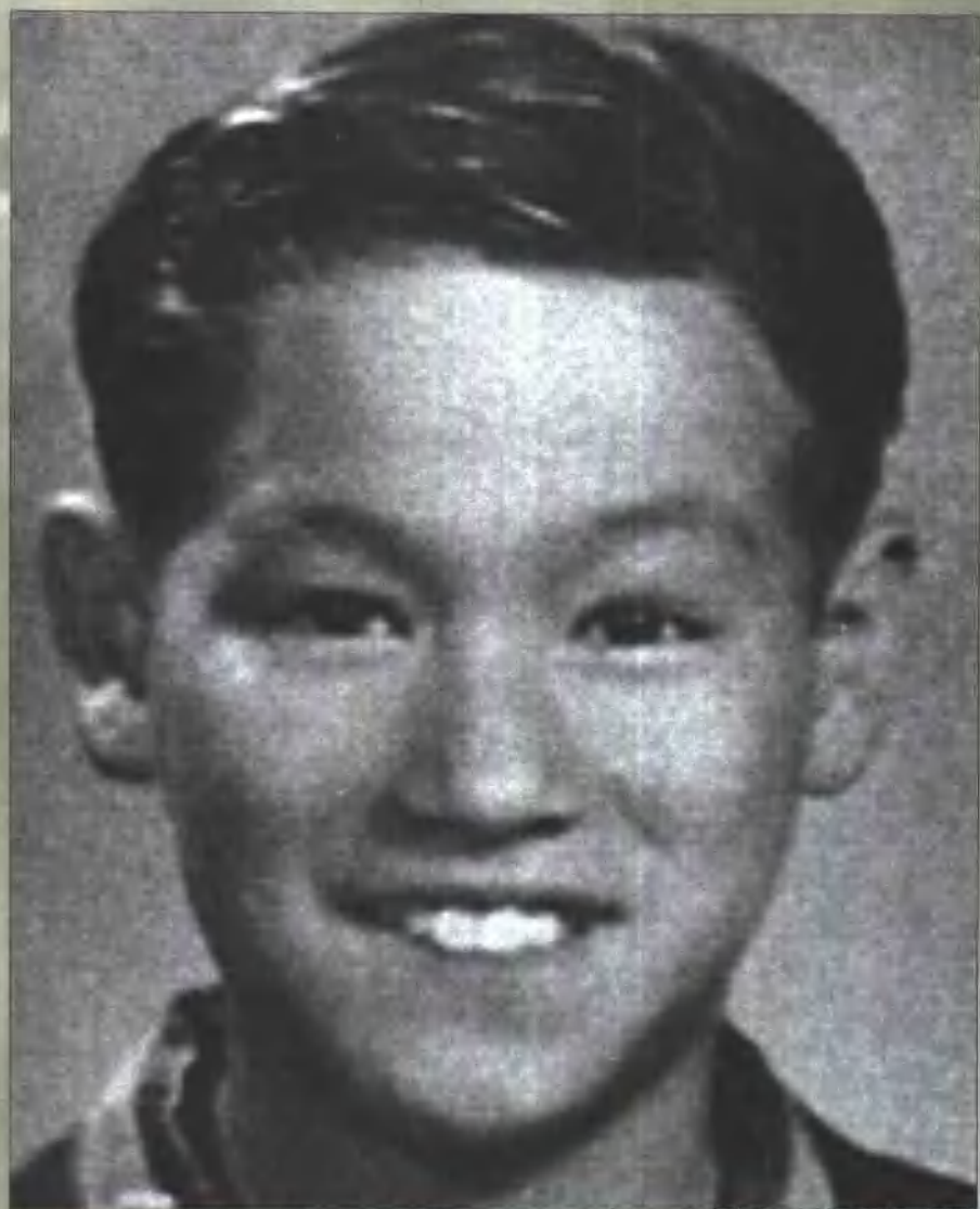
少年时代的李小龙眉清目秀。