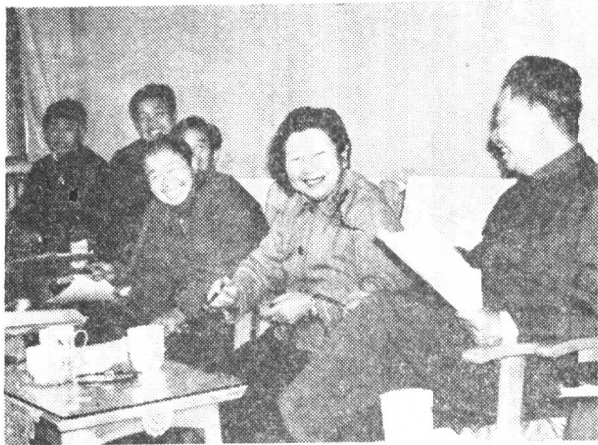
同江苏代表一起 参加五届四次人 代会的小组讨论 (一九八一年)