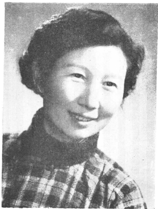
摄于被评为南京市先进 工作者后(一九五六年)