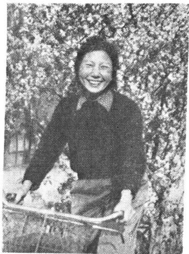
在南师附小校园(一九五六年)