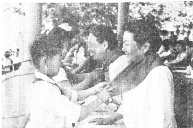
在庆祝“六一”国 际儿童节大会上 (一九七九年)