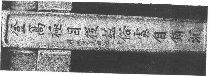
秦山云步桥酌泉亭联