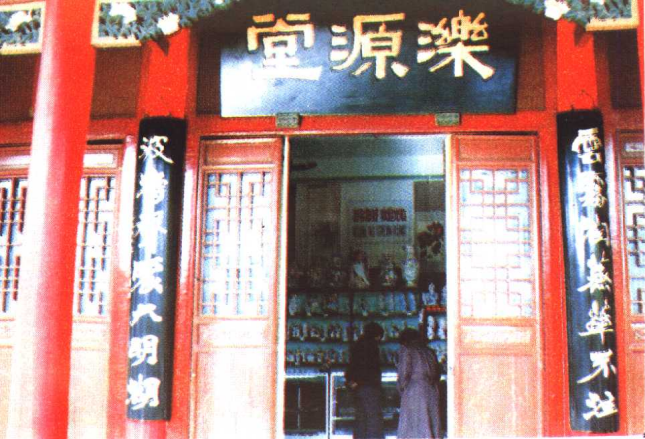
济南趵突泉乐源堂联