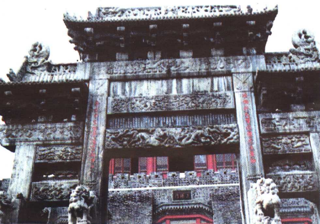
泰安岱庙正阳门石坊联