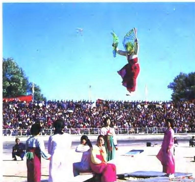
朝鲜族跳板 魏之供