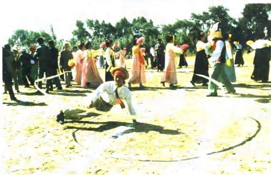
朝鲜族农乐舞