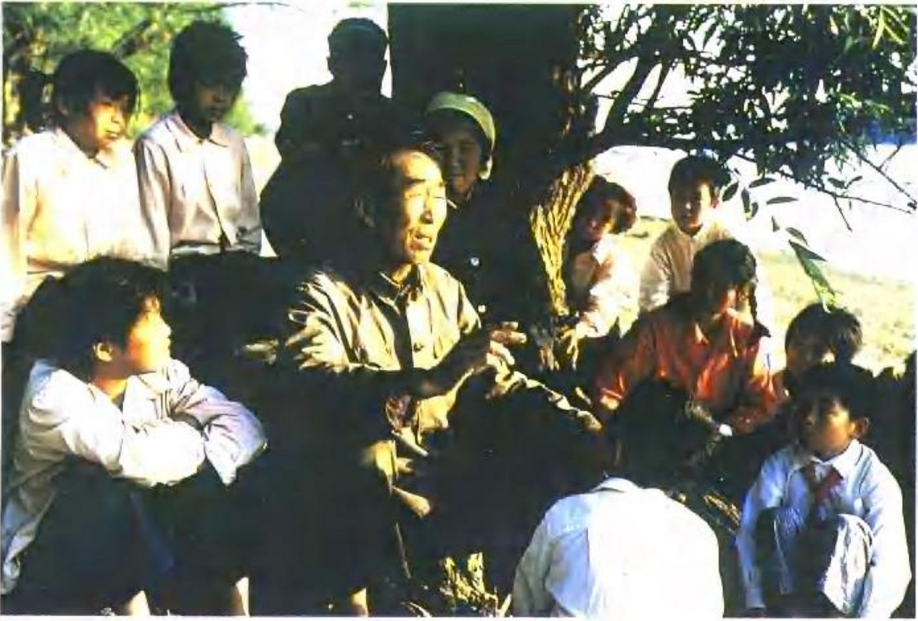
赫哲族说唱——依玛堪