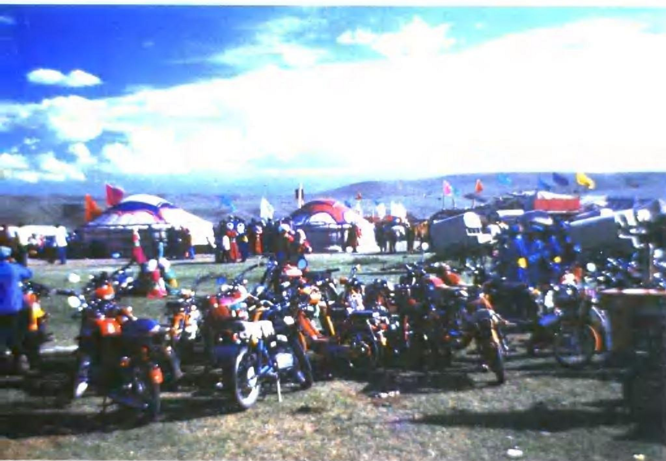
那达慕大会（蒙古族）