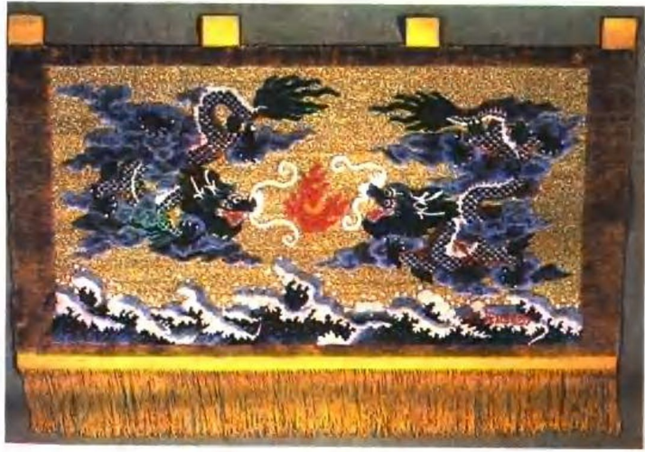
内蒙古包头市生产的金丝地毯