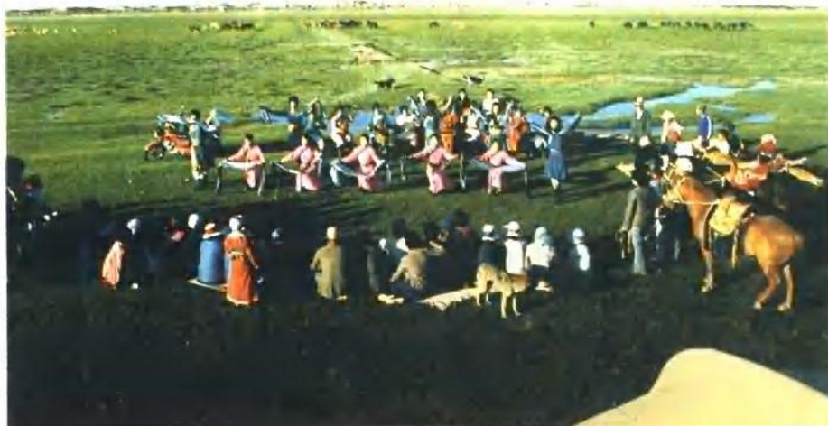
蒙古族歌舞 经之供