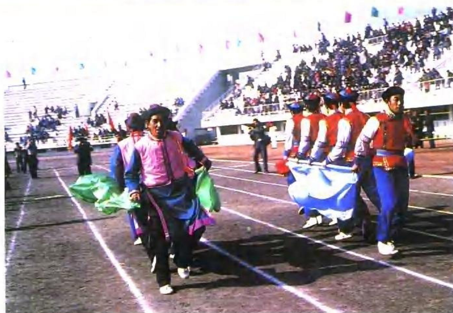
满族赛呼威