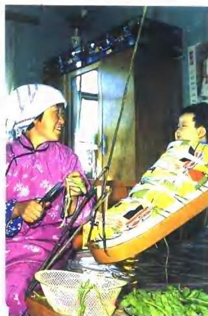
鄂温克族