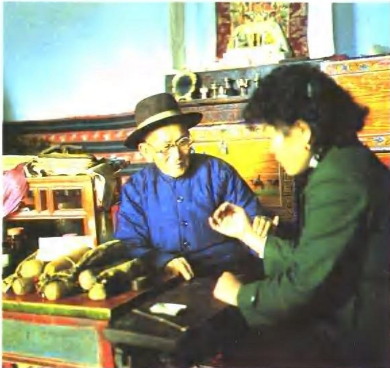
蒙医为群众诊治疾病