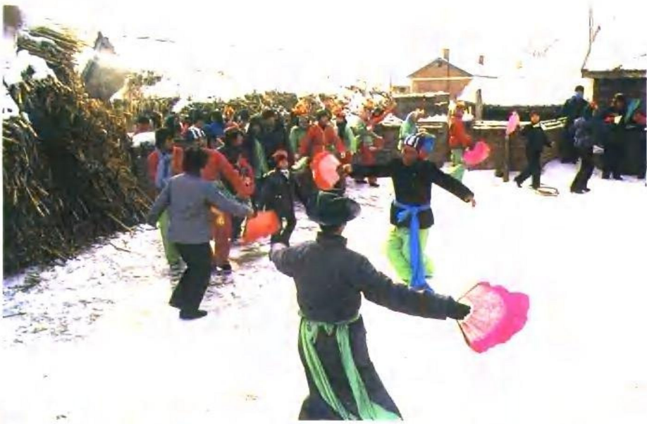
满族大秧歌