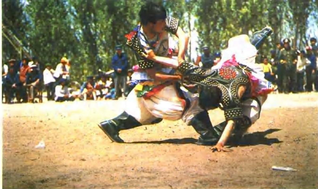
蒙古族摔跤