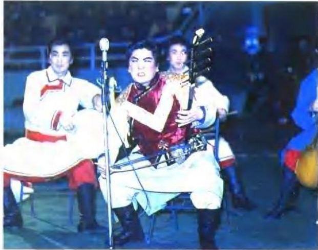
蒙古族好来宝演唱