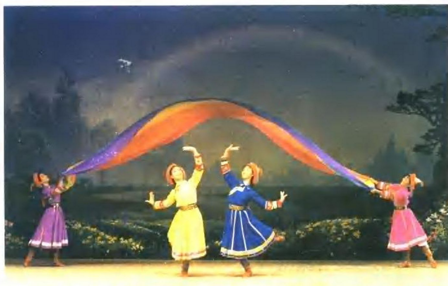
鄂温克族舞蹈《彩虹》