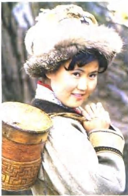
鄂伦春族