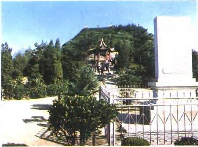
呼和浩特市昭君墓