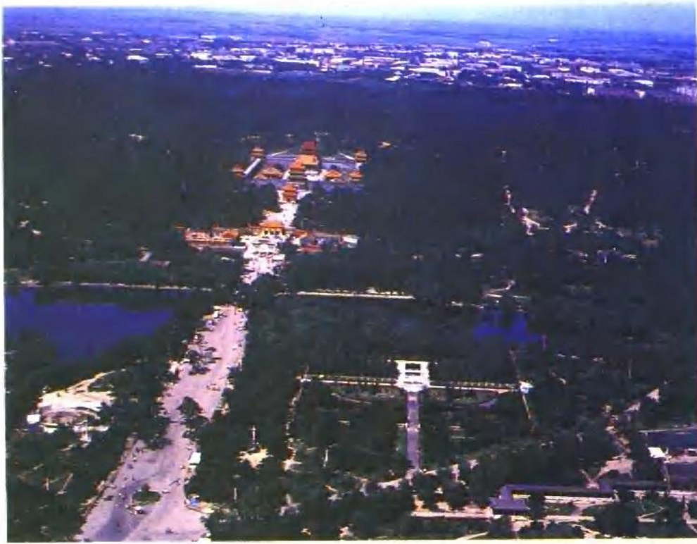
沈阳昭陵