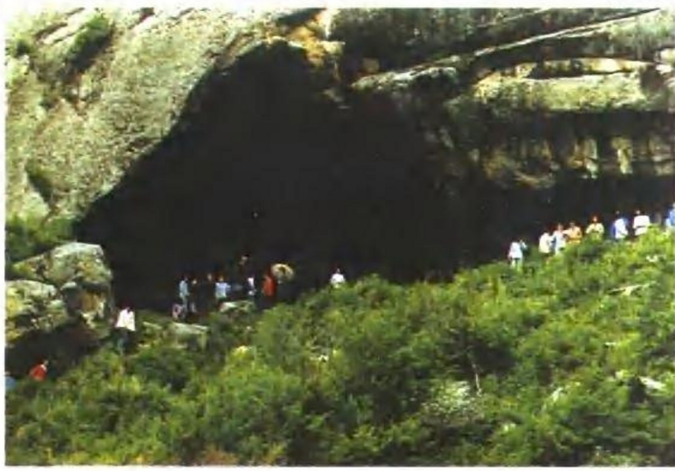
内蒙古境内的阴山岩画