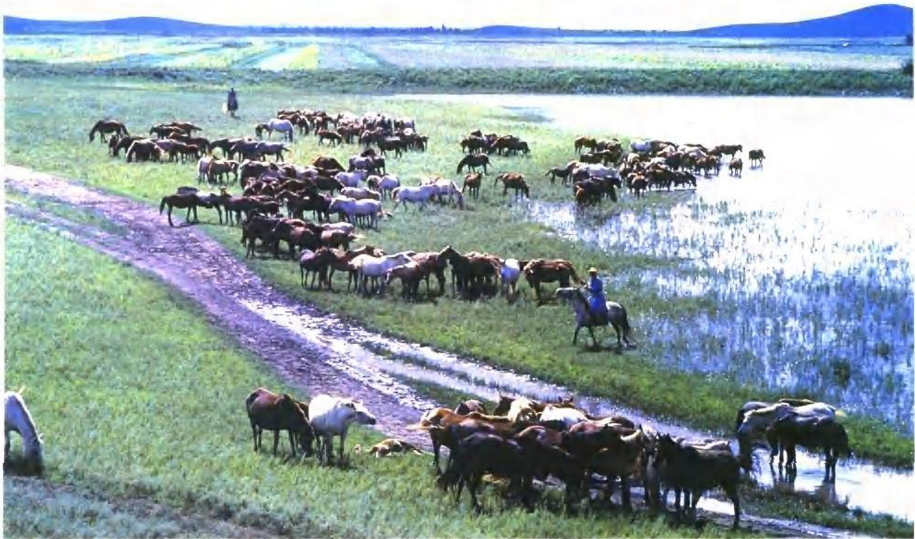
内蒙古草原