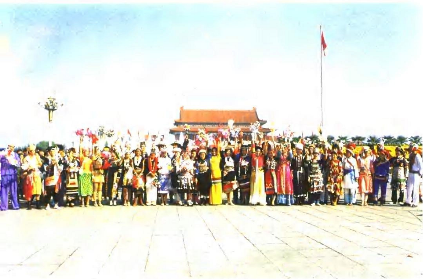
生活在祖国大家庭中的 55 个少数民族