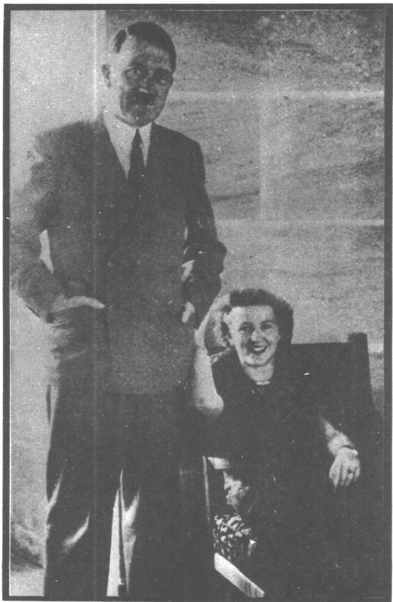
大拇指——力量的显示