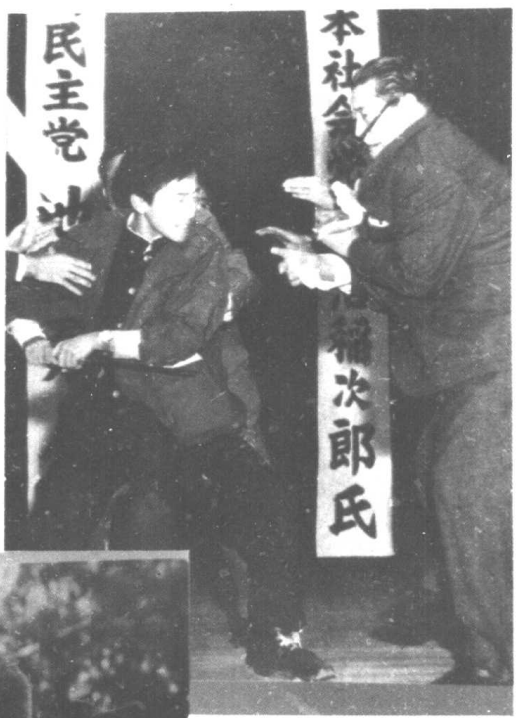
受到威胁时的人体信号