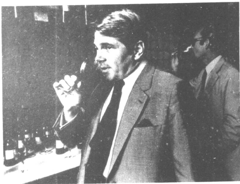
嘴在忙着,眼睛、手也没闲着