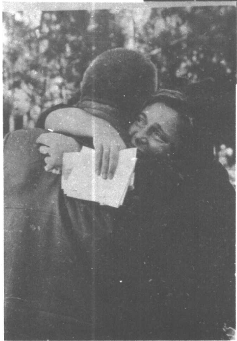
千言万语融会在拥抱中