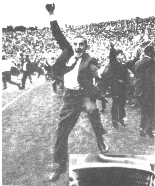
◀ 人何时会有这种举动