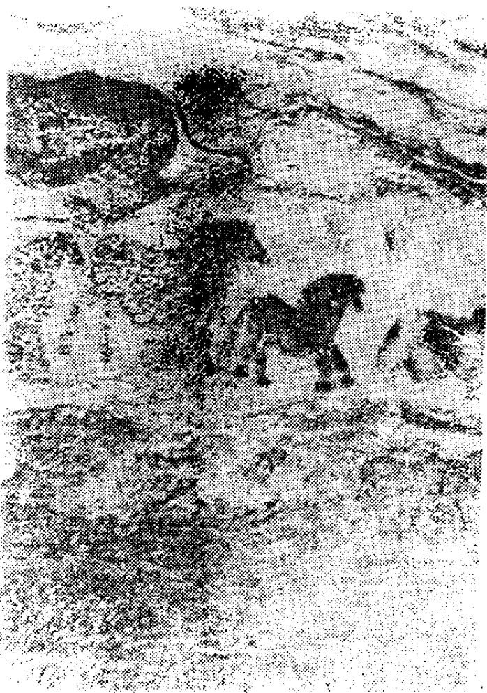
2 法国原始洞穴壁画

所有这些洞穴壁画所描绘的，基本上都是动物。间或也出现似人似兽的东西，经过考察，原来是装扮成兽类的人。例如一个被称为“鹿角巫师”的形