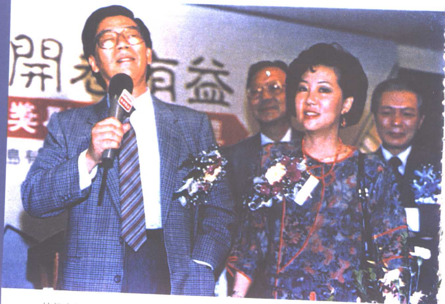
柏杨夫妇为香港电台“开卷有益”节目主持颁奖典礼。