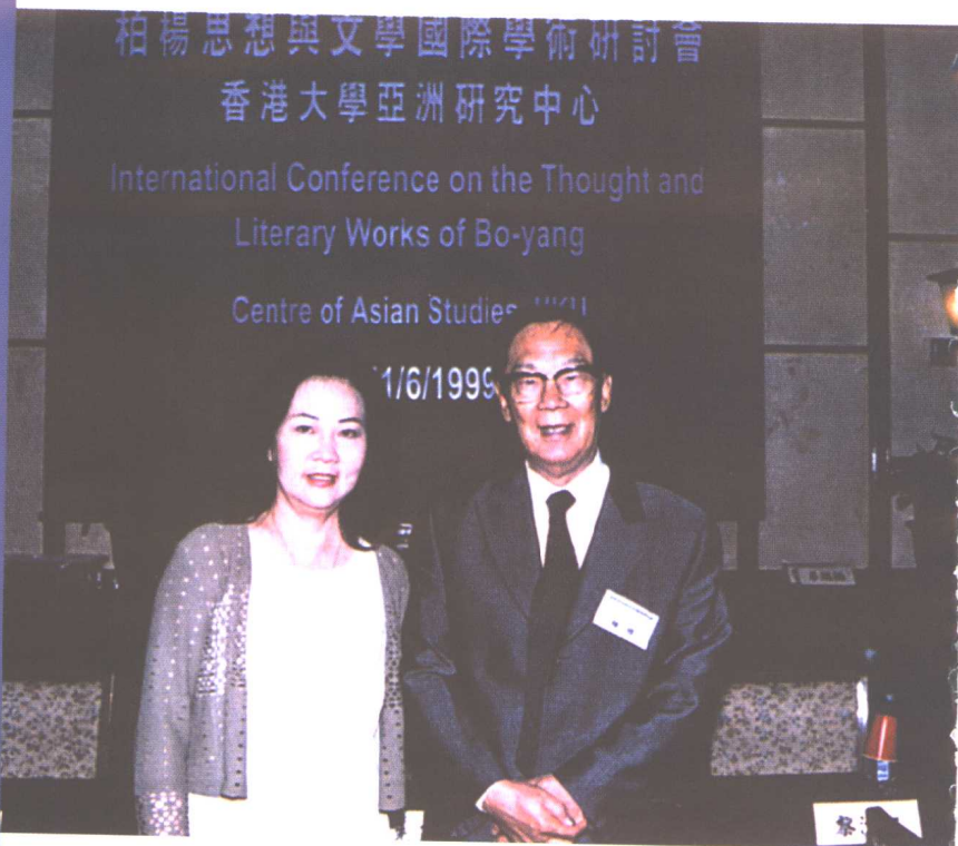
香港大学举办“柏杨思想与文学国际学术研讨会”，柏杨与香华摄于会场。