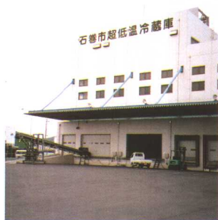
水产品批发市场超低温冷藏库