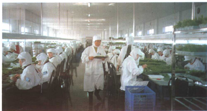
鲜活农产品加工整理