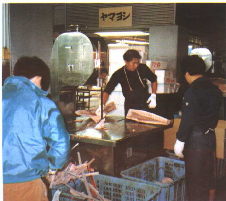
中间批发商对水产品进行切块加工