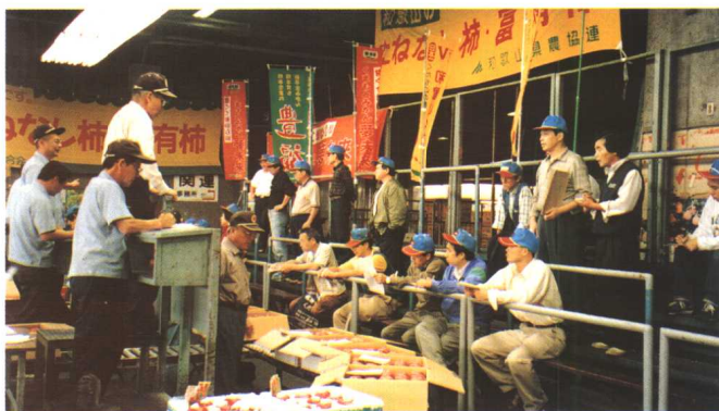
大阪批发市场苹果拍卖现场