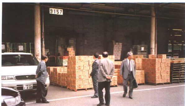
全农生鲜食品集配中心一角