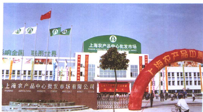
上海农产品中心批发市场