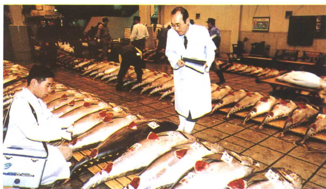
拍买前的卫生及新鲜度检查