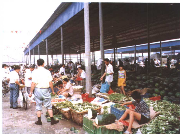
鲜活农产品批发市场一角