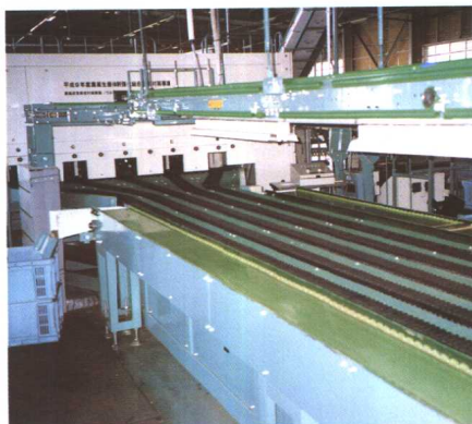
农协西红柿挑选设施