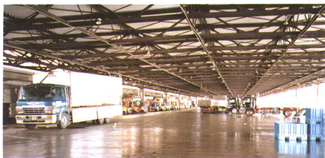
石卷市水产品地方批发市场批发大厅