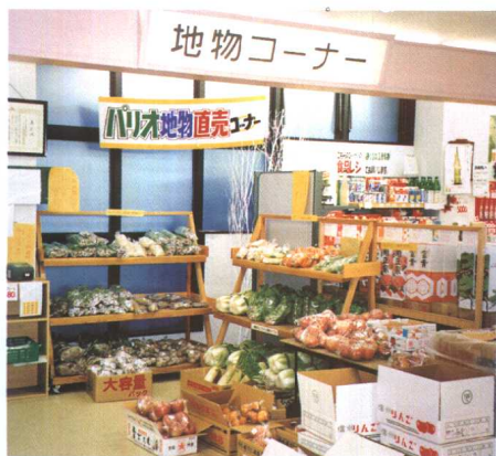
超市中设置的本地产果蔬“直销角”