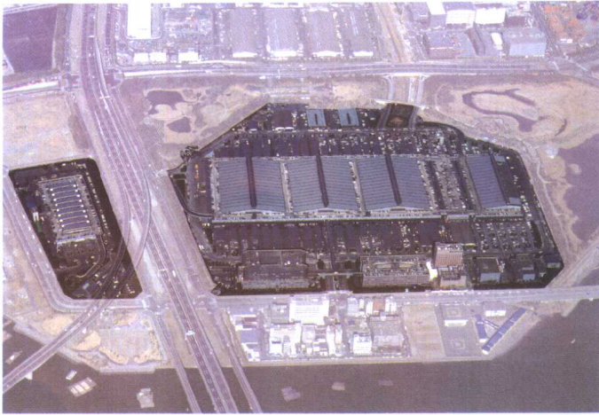
东京都中央批发市场大田市场鸟瞰