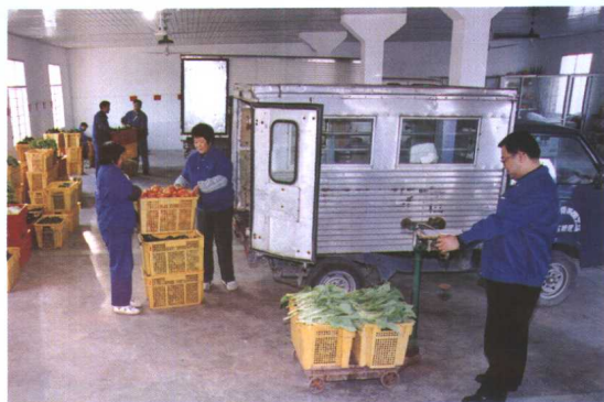
鲜活农产品销售配送