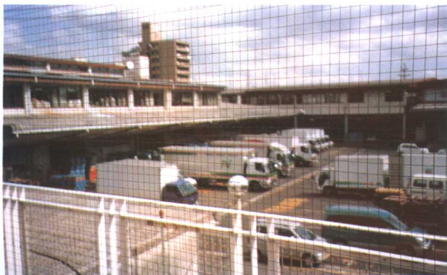
宫城县消费者生活协同组合一角