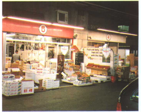
批发市场内中间批发商开设的店铺