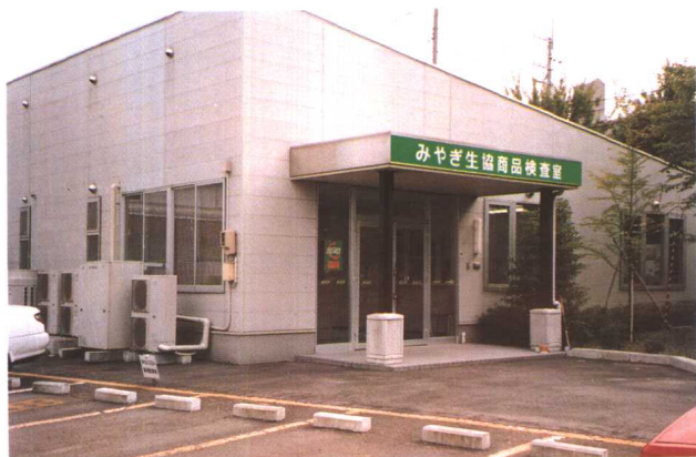
宫城县生协鲜活农产品检查室