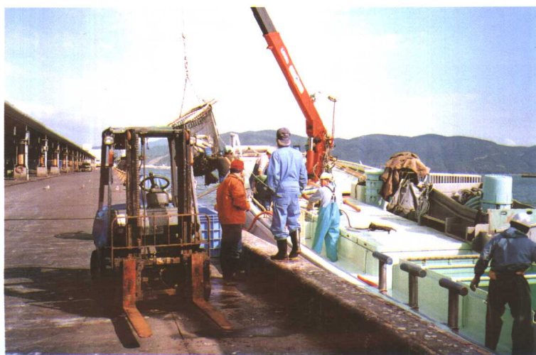
鲜活水产品运抵批发市场