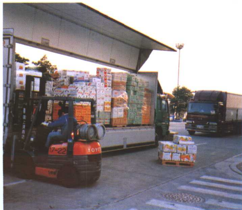
将经拍卖的鲜活农产品装车外运