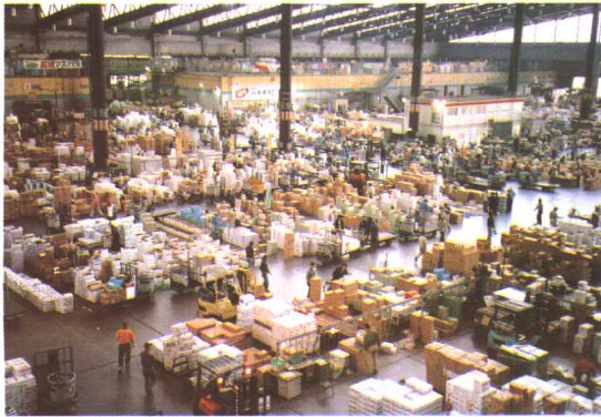
大田市场果蔬部批发大厅内景