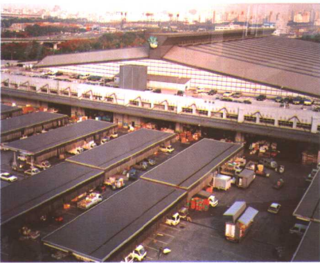
大田市场果蔬部外景