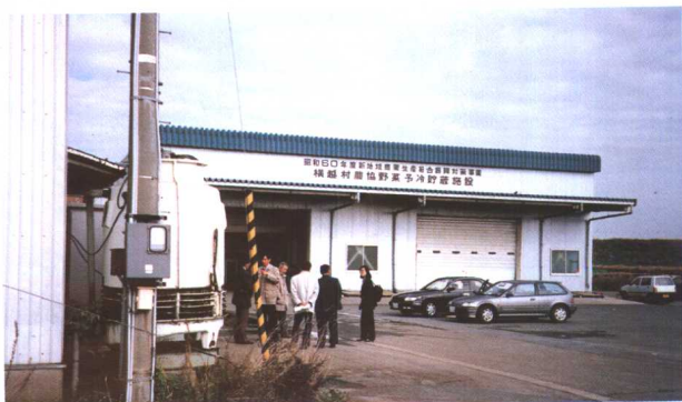
农协蔬菜预冷贮藏设施