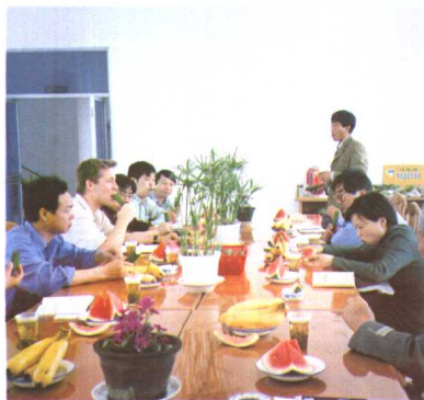
有机农产品品尝会