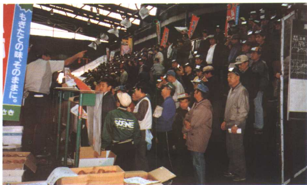
大田市场果蔬拍卖现场