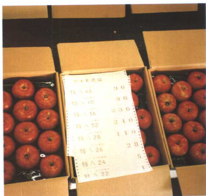
经农协标准化生产，装箱后的苹果