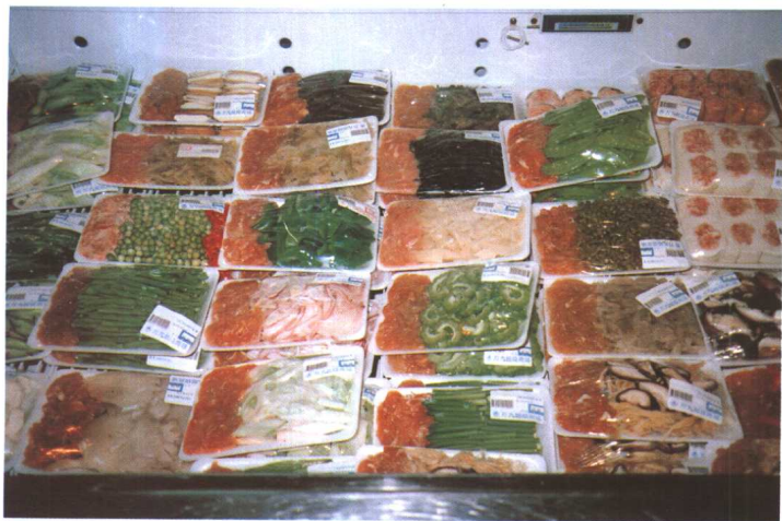
厨房工程—小包装食品