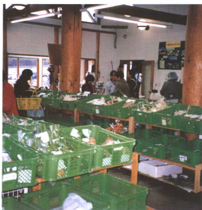
附设于农村观光休闲旅游设施内的 鲜活农产品直销所