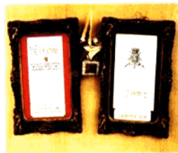
中国民营科技实业优秀单位 浙江省级文明单位