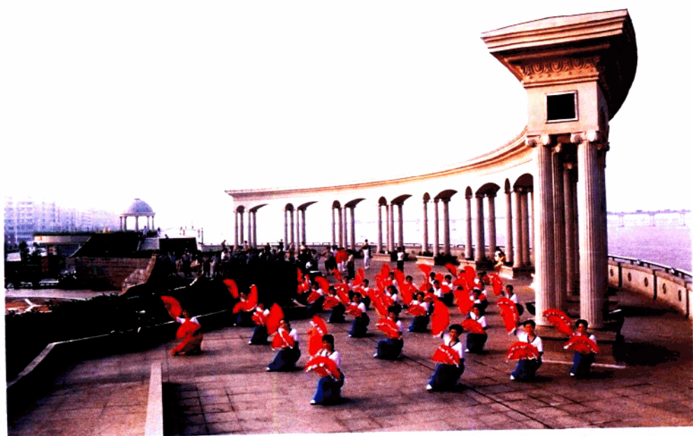
温州县城建设中规模最大的工程——瑞安滨江大道