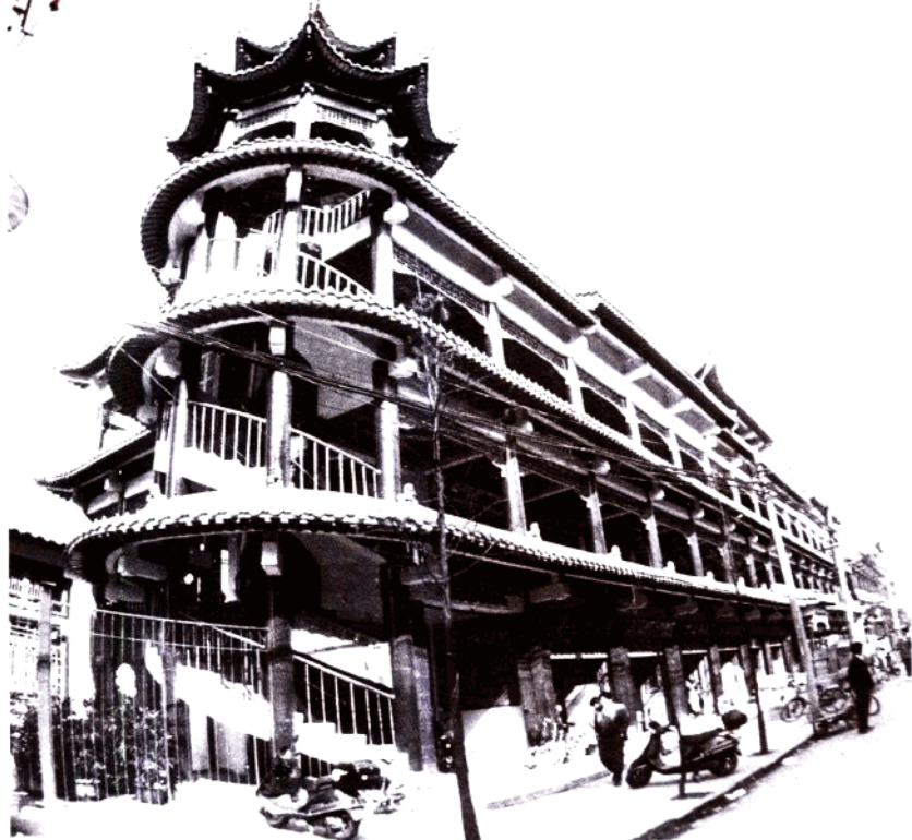
古典建筑 现代灯市