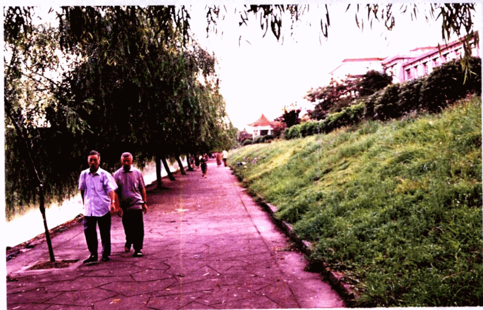
浙江最绿的县城——苍南灵溪