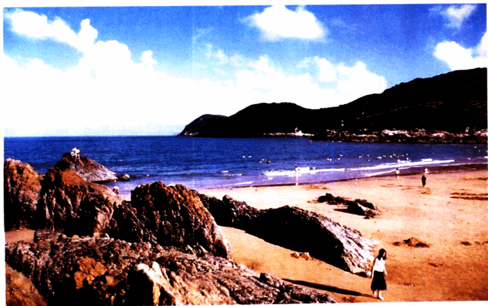
中国首个“世界生物圈保护网络”的海洋类型自然保护区 ——平阳南麂