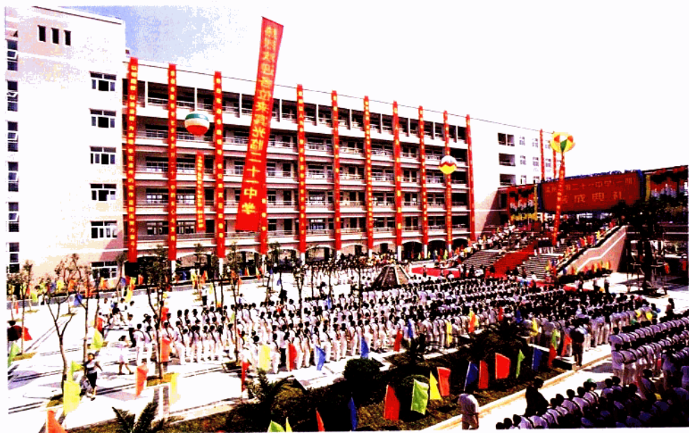
温州市直属中学中规模最大的完全中学——二十一中学