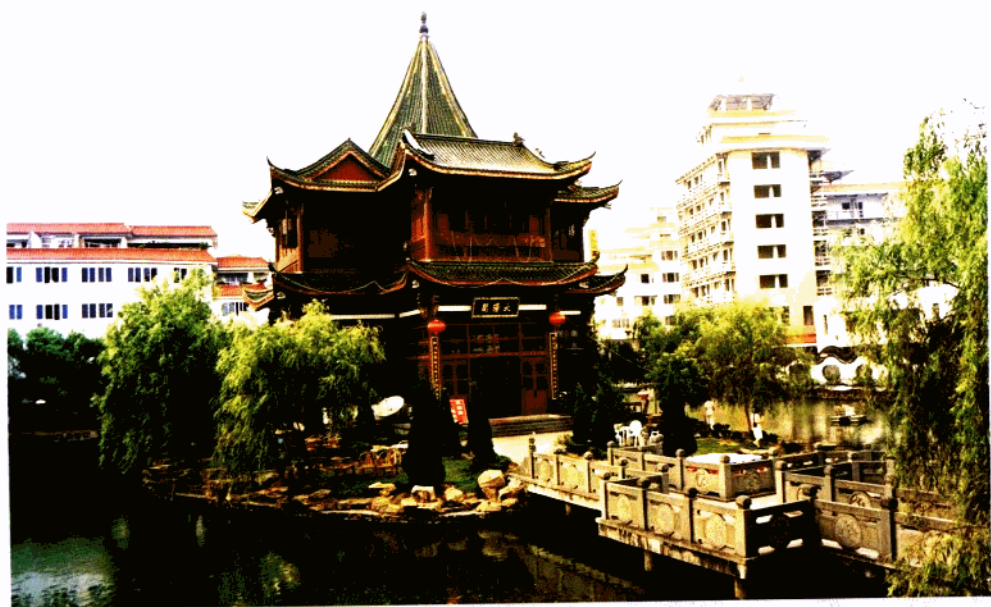
社会主义新农村建设示范村——乐清前岸村