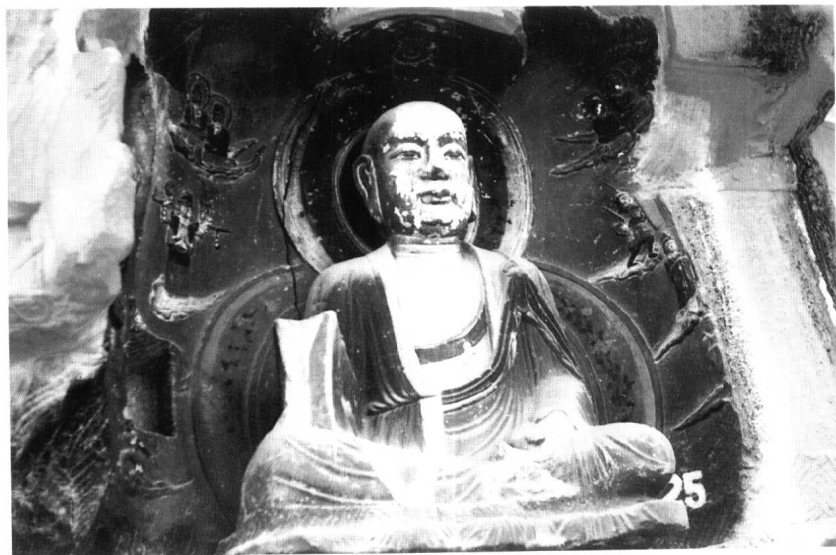
圖版三 唐地藏菩薩與六道輪回圖