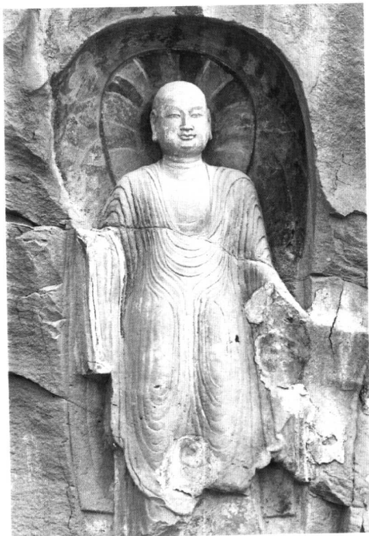
圖版四 唐地藏菩薩立像