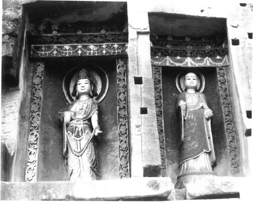
圖版一 唐地藏觀音像