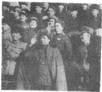
图⑥1949年11月张治中和彭总、王震同志在迪化阅兵台上。