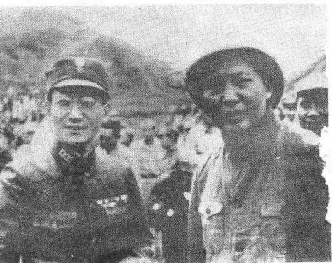
图④1945年10月11日，毛泽东和张治中在延安机场。