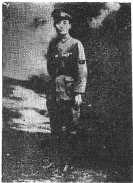
图②张治中在1932年一二八 抗日战争时留影。