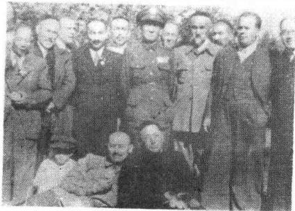
图⑤1946年，张治中等与三区领导人合影。前排右起为刘孟纯、赖希木江。中排右起第一人为屈武、第三人为艾肯木拜克和加、第四人为张治中、第五人为阿合买提江、第七人为刘泽荣。