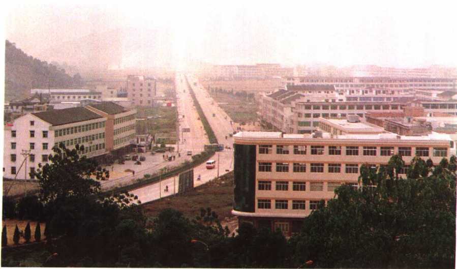
新颜：今日燎原已建成具有现代气息的新兴集镇。