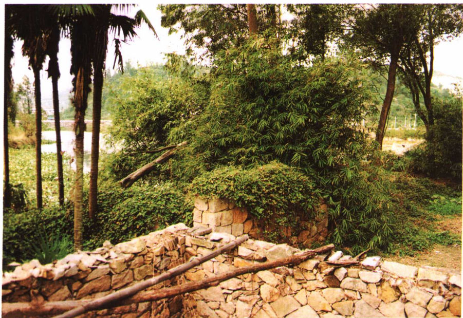
文化大革命期间埋藏资料的菜园旧址。