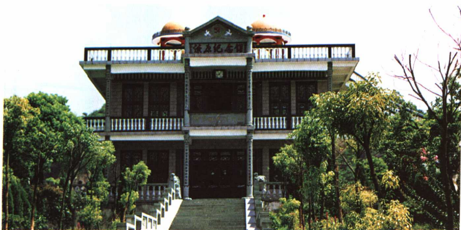
保存并介绍当年燎原社改革情况的燎原纪念馆。