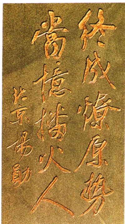
中国社会科学院研究员杨勋题。