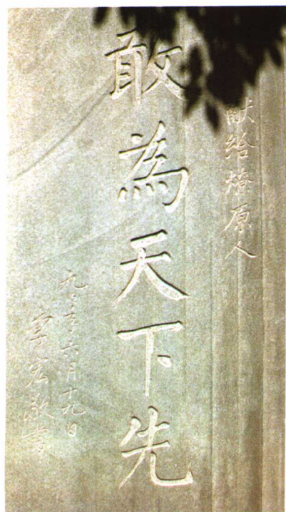
原中共永嘉县委书记、温州地委 副书记、浙江省粮食厅厅长李宏题。