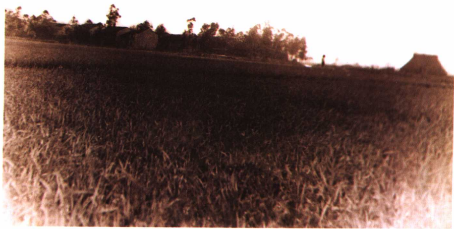
旧貌：当年燎原是古老、贫困的村庄。