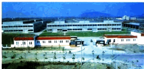
南通經濟技術 開發區一瞥