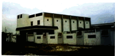
即將竣工 的陳兆民 文化中心