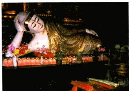
定慧禪寺蓮白玉臥佛