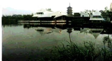
文峰塔與文 峰公園