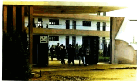
國 本 中 學