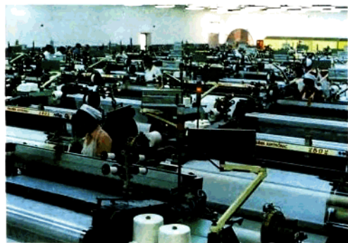
南通第一棉紡織廠(原大生一廠)噴氣織機車間