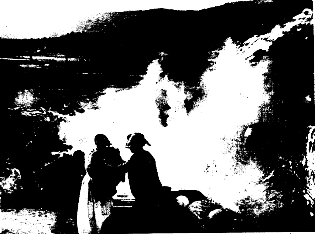
(五) 冒着美军飞机疯狂扫射，某部战士在烈火中抢救朝鲜居民。