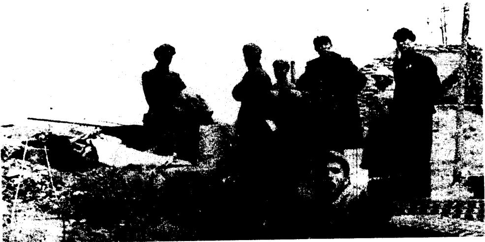
(二十七) 在西海岸为粉碎敌人登陆，日夜兼程修筑海岸工事。图为西海岸指挥部副司令员梁兴初等首长，检查防御部署和工程进展情况。