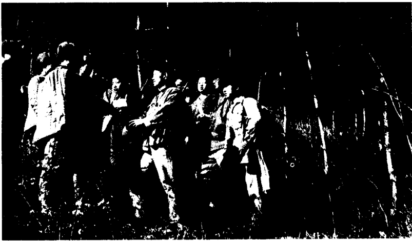
(十六) 突破“三八 线”以后， 同朝鲜人民 军游击队会 师。