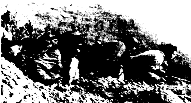
(十七) 汉江南北两 岸日夜阻击 敌人。图为 336团5连 在草下南山 浴血奋战， 三昼夜，打 退美骑一师 一部，大量 飞机、坦克 配合下的 十三次攻 击。