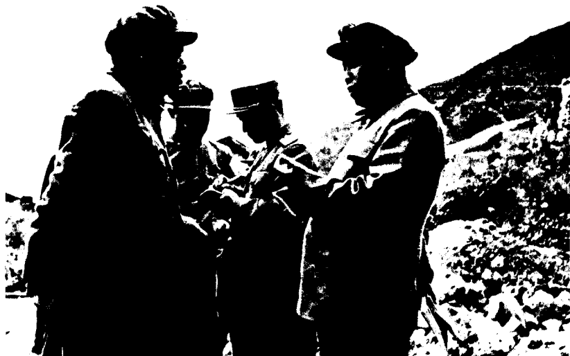
(一) 中国人民志愿军司令员兼政治委员彭德怀同志同朝鲜民主主义人民共和国首相金日成同志在前线某地。