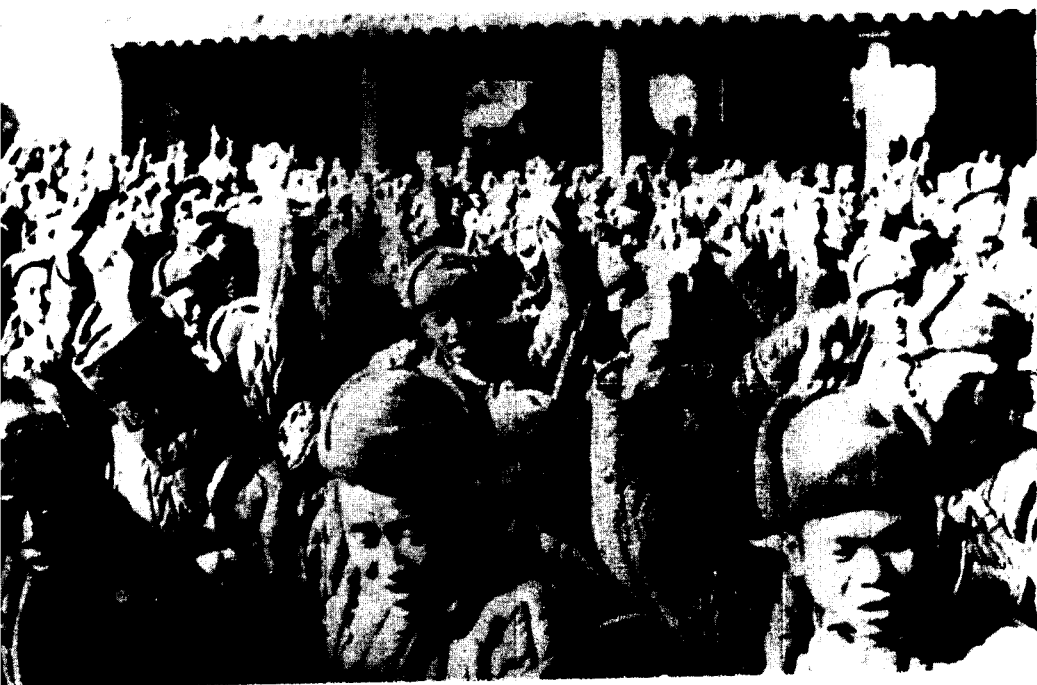
(四) 38军全体将士于铁岭、昌图、开原等地举行“抗美援朝、保家卫国”誓师大会。