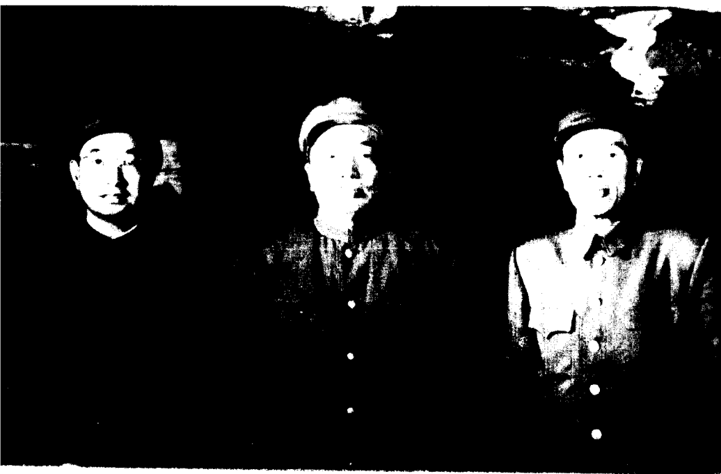
(二) 彭德怀司令员和陈赓、邓华副司令员在一起。