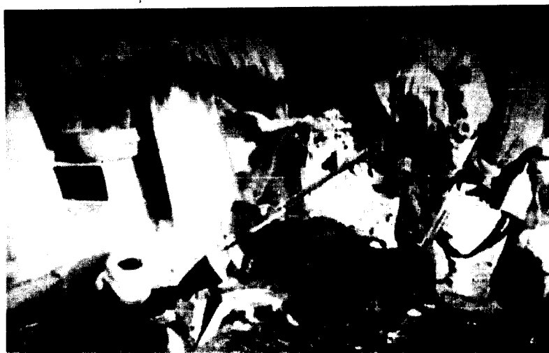
(六) 在第一次战役中，在球场以南玉泉站338团歼敌一个加强连，受到“志司”嘉奖。图为战士正在俘虏敌兵。