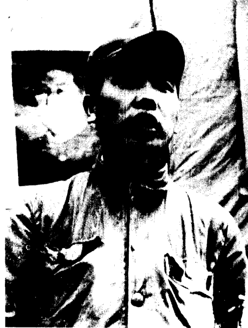
(二十一) 特等功臣、一级战斗英雄曹玉海。