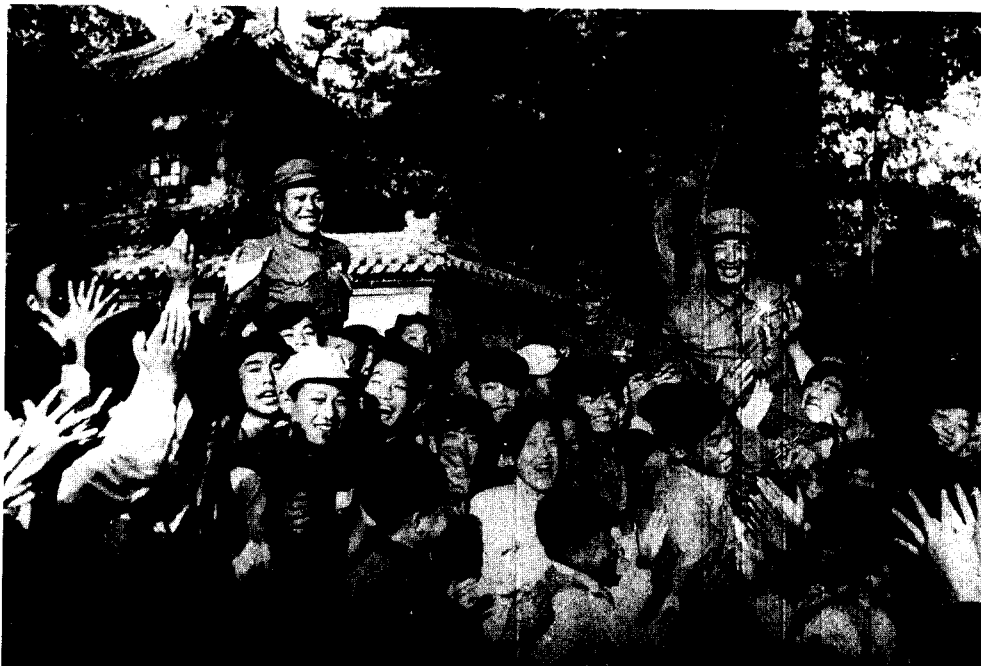
(二十三) 志愿军出国作战一周年，38军特等功臣、二级战斗英雄徐恒禄(右端被抬举者)，在北京受到青年学生的热烈欢迎。