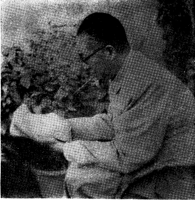
鄭振鐸在北平寓所 (一九五七年夏)