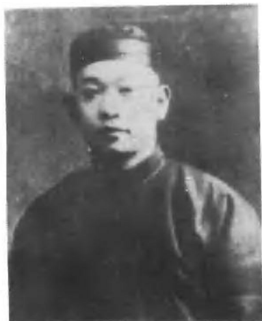
1928年初，郭亮任中共湘鄂 赣边特委书记时来岳州的化装像