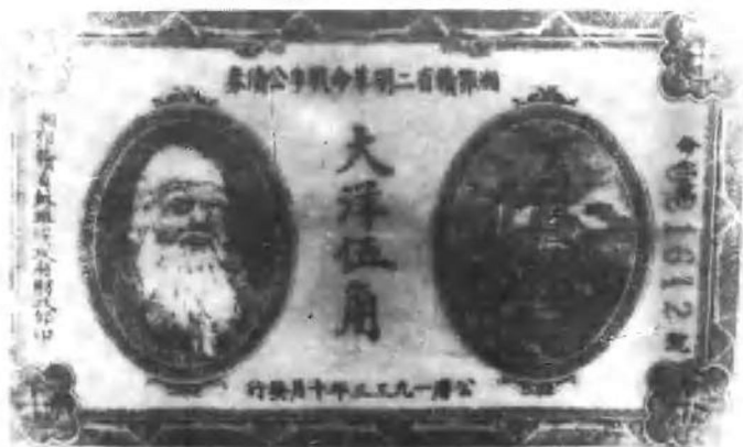
1933年10月发行的湘鄂赣省二期革命战争的公债券