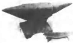
1931年冬湘鄂赣省兵工厂迁驻修水上衫向公坳。图为制造武器、炸药用的铁砧、碾槽。