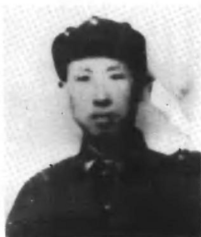
湘鄂赣边特委书记 王首道同志（1929年）