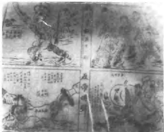
湘鄂赣省苏维埃政府文化部出版的《战斗画报》的一部分。