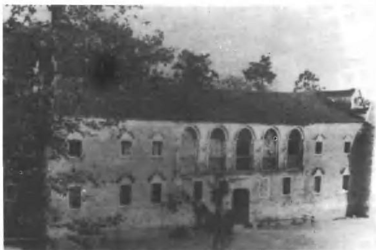
红三军团成立旧址（现大冶县刘仁八三房村）。