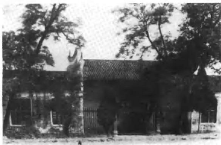
平江起义旧址——平江天岳书院