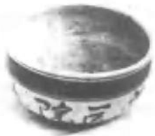
修水苏区瓷厂为中国工农红军湘鄂赣第一医院生产的青花瓷钵。