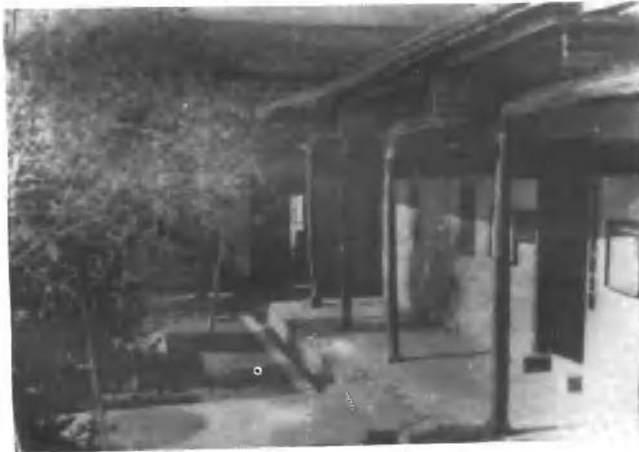
—— 中共湘鄂赣省委旧址 (1932—1934年) —— 万载小源王家屋