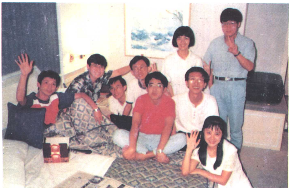
场上是对手，场下是朋友——复旦大学队和马来亚大学队在一起