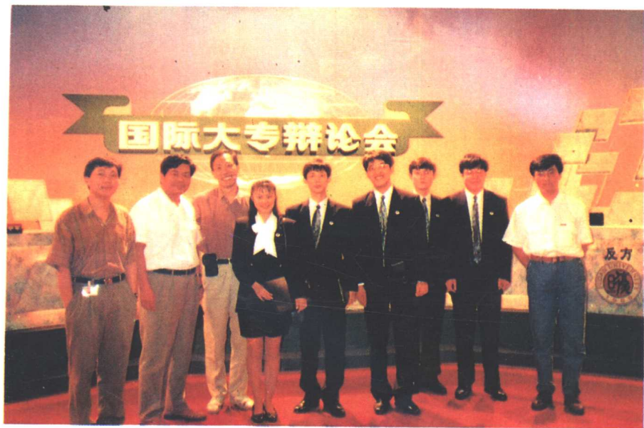
复旦大学辩论队与辩论会主办单位之一中国中央电视台人员在一起