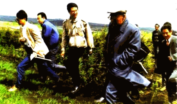
● 1995年春，中共黑龙江省委书记岳岐峰，风尘仆仆视察明水县葡萄苹果农业开发项目区。