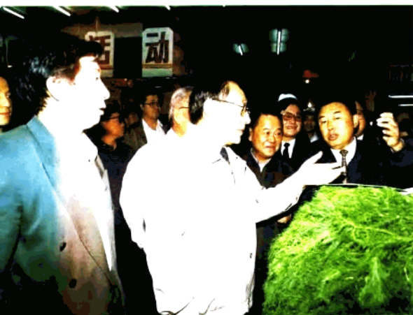
● 国务院副总理李岚清在省长田凤山陪同下视察黑龙江蔬菜市场和“菜篮子”工程。